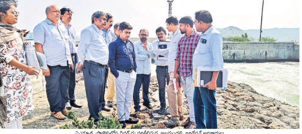
ఎమ్మార్పీ ప్రాజెక్టులోని సిస్టర్స్ను పరిశీలిస్తున్న జలమండలి, ఇలిగేషన్ అధికారులు