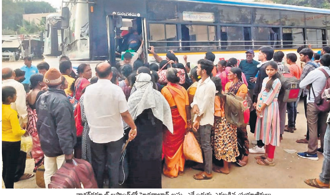
నాగర్ కర్నూల్ బస్స్టాండ్ లో హైదరాబాద్ బస్సు ఎక్కేందుకు ఎగబడిన ప్రయాణికులు