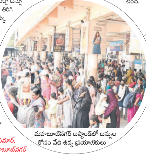
మహబూబ్ నగర్ బస్స్టాండ్ లో బస్సుల కోసం వేచి ఉన్న ప్రయాణికులు

మహబూబ్ నగర్ అర్బన్, జనవరి 11 : మహిళా బస్ డిపోలోని పరిధిలోని ప్రయాణికులు ఆ డిపోలోని సబ్స్టేషన్లకు చేరుకోవడానికి సంక్రాంతి సందర్భంగా విద్యార్థులకు సెలవులు ఇవ్వడంతో ఒక్కసారిగా రద్దీ పెరిగింది. బస్సులు లేక ప్రయాణికులు బిల్ల వెలుగుతో పడిపోతున్నారని ప్రయాణికులు ఆరోపిస్తున్నారు. ప్రధానంగా కొన్నే, షాద్ నగర్, నవాబ్ పేట వంటి పట్టణాలకు బస్సులు లేక ప్రయాణికులు ఆశ్రయిస్తున్నారు. కనీసం ఐదుగురు గంటలు బస్సులు కోసం ప్రయాణికులు వేచి ఉండాలి వస్తుంది. స్వేచ్ఛలో బస్సులకు అదనపు చార్జీలు.. హైదరాబాద్ బస్ డిపో నుంచి వచ్చే సైబల్ బస్సులకు అదనపు చార్జీలు వసూలు చేస్తున్నారని ప్రయాణికులు ఆరోపిస్తున్నారు. వేళ్లలో గమ్యానికి చేరుకోవడానికి ప్రయాణికులు ఆదికారులు ఉన్న బస్సులను కుడించుకోవాలి వేళ్లలో గమ్యానికి చేరుకోవడానికి ప్రయాణికులు నానా అవ్వాలి పడుతున్నారు. వల్లె వెలుగు బస్సులకు పట్టుం బోర్డులు నాగర్ కర్నూల్ జిల్లాలోని డిపోల నుంచి హైదరాబాద్ వెళ్లే బస్సులకు పట్టుం బోర్డులు వేసి పురుష ప్రయాణికులు నుంచి అధికంగా చార్జీలు వసూలు చేస్తున్నారు. నాగర్ కర్నూల్, కొల్లా ఫూల్, కల్వల్పల్లి, అచ్చంపేట డిపోల నుంచి నడిపిస్తున్న కొన్ని వల్లె వెలుగు బస్సులకు దూర ప్రాంతాల బోర్డులు వేసి సైబల్ బోర్డులు అధికంగా చార్జీలు వసూలు చేస్తున్నారని విమర్శలు వస్తున్నాయి. పల్లె వెలుగు బస్సులు హైదరాబాద్, గద్వాలలో ప్రాంతాలకు నడుపుతూ పురుష ప్రయాణికులతో అధికంగా వసూలు చేస్తున్నారు. ఇదేమని ప్రశ్నిస్తూ ఉన్న కొంతమంది ప్రయాణికులు నుంచి బస్సులు డిపోలు 70శాతం పెరిగింది. అందుకు అనుగుణంగా బస్సులను సైబల్ వెంచా తీసిన అధికారులు పట్టుం బోర్డులు వేసి చార్జీలు వసూలు చేస్తున్నారని ప్రయాణికులు ఆరోపిస్తున్నారు.