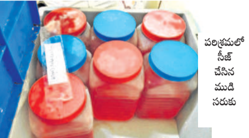
పరిశ్రమలో సీజ్ చేసిన ముడి సరుకు

నందిగామ, జనవరి 12 : హేమాక్షి బేకర్స్ పరిశ్రమలో.. మండలంలోని మేకగూడ పుడ్ సీస్ట్ అధికారుల తనిఖీలు శివారులో ఉన్న హేమాక్షి బేకర్స్ పరిశ్రమలో పుడ్ సీస్ట్ అధికారులు ఆదివారం సోదాలు నిర్వహించారు. గడువు ముగిసిన ముడిసరుకు వాడుతున్నట్లు గుర్తించి, సీజ్ చేశారు. వాటి విలువ రూ.14 లక్షలు ఉన్నట్లు, పరిశ్రమపై కేసు నమోదు చేసినట్లు తెలిపారు. ఈ పరిశ్రమలో తయారయ్యే బేకరీ పదార్థాలు దేశ, విదేశాలకు సరఫరా చేస్తుంటారని సమాచారం.