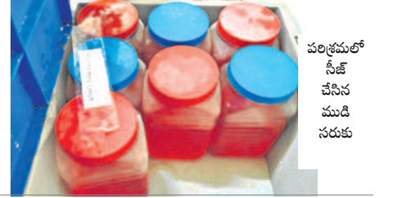
పరిశ్రమలో సీజ్ చేసిన ముడి సరుకు

నందిగామ, జనవరి 12 : హైమాజీ బేకరీస్ పరిశ్రమలో.. మండలంలోని మేకగూడ పుడ్ల సీసీ అధికారుల తనిఖీలు జియారులో ఉన్న హైమాజీ బేకరీస్ పరిశ్రమలో పుడ్ల సీసీ అధికారులు ఆదివారం సోదాలు నిర్వహించారు.