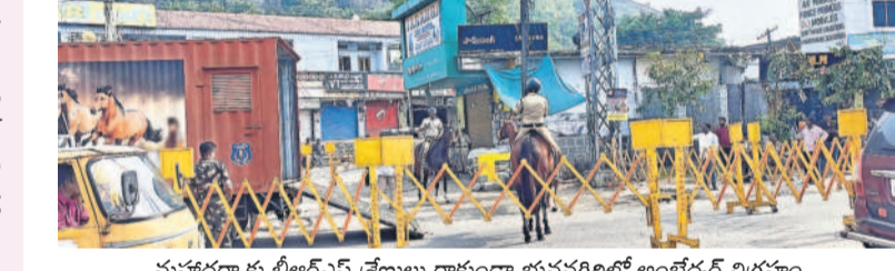
మహాధర్మాకు బీఆర్ఎస్ శ్రేణులు రాకుండా భువనగిరిలో అంబేద్కర్ విగ్రహం చుట్టూ పోలీసులు కంచ వేసి అడ్డం దోలతో పోలీస్ పహారా