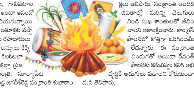
క్షలు తెలిపారు. సంక్రాంతి అందరి జీవితాల్లో మరన్ని వెలుగులు నిండి సుఖ శాంతితో జీవించాలని ఆకాంక్షించారు. కాంగ్రెస్ పాలనలో కొత్తగా ఒరిగిందేమీ లేదన్నారు. ఈ సంక్రాంతి పండుగతో అయినా రేవంత్ పాలనకు కనువిప్పి కలిగి అభివృద్ధికి ఆడుగులు చదాలని కోరుకుంటూ మన తెలిపారు.

రామగిరి/నేరేడుపల్లె/సూర్యాపేట లోని, జనవరి 12 : సంక్రాంతి సందడి పట్టణం ప్రజలు, వివిధ ప్రాంతాల్లో ఉండి వారు సాంత్వాళ్లకు రావడంతో వచ్చి లన్నీ కొత్త శోభను సంతరించుకున్నాయి. ఆడవిడ్డలు, కొత్త అబ్బళ్లు, బండ్లులతో ఇల్లిల్లా కళకళలాడుతున్నాయి. మాడు రోజుల పండుగలో సోమవారం భోగి పండుగను నిర్వహించేందుకు అంతా సన్నద్ధులు ఉన్నారు. ముగ్గులు, గొబ్బెమ్మలతో లోగిళ్లను వడ్డం జిత్తు చేయనున్నారు. హండ్లాల కీర్తనలు, గంగిరి