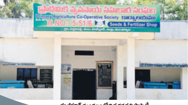
మాజీపూర్ మండలంలోని పక్షనపల్లి సాస్టి

ఆన్ లైన్ లో అడిగే సమస్య ఉందని చూపిస్తున్న రైతులందరికీ పండుగయ్యాక మాఫీ డబ్బులు ఖాతాల్లో పడుతాయి. పక్షనపల్లిలో మొన్నమే మా ఇద్దరు అధికారులు వెళ్లి అడిగే చేసి వచ్చారు. మిగిలిన సాస్టిలో అడిగే చేస్తున్నారు. రైతులెవరూ కంగారు పడాలి వని లేదు. రూ. 2 లక్షల లోపు రుణం ఉండి, అర్హులైన వారందరికీ మాఫీ అవుతుంది. సాస్టిలో వాటాధనం కట్టిన వారి నుంచి కొంత మొత్తం కట్ చేసుకుంటారు. తిరిగి చెల్లించేటప్పుడు అది కట్ చేసి చెల్లించుకుంటారు. కొందరి రైతులు దీనిపై అవగాహన పెంచుకోవాలి. నిజంగా అలాంటిది ఎక్కడైనా ఉంటే మాకు చెప్పండి. కచ్చితంగా వర్తనలు తీసుకుంటాం. - సంజీవ్ రెడ్డి, డి.సీ.సీ, మంచార్యాల