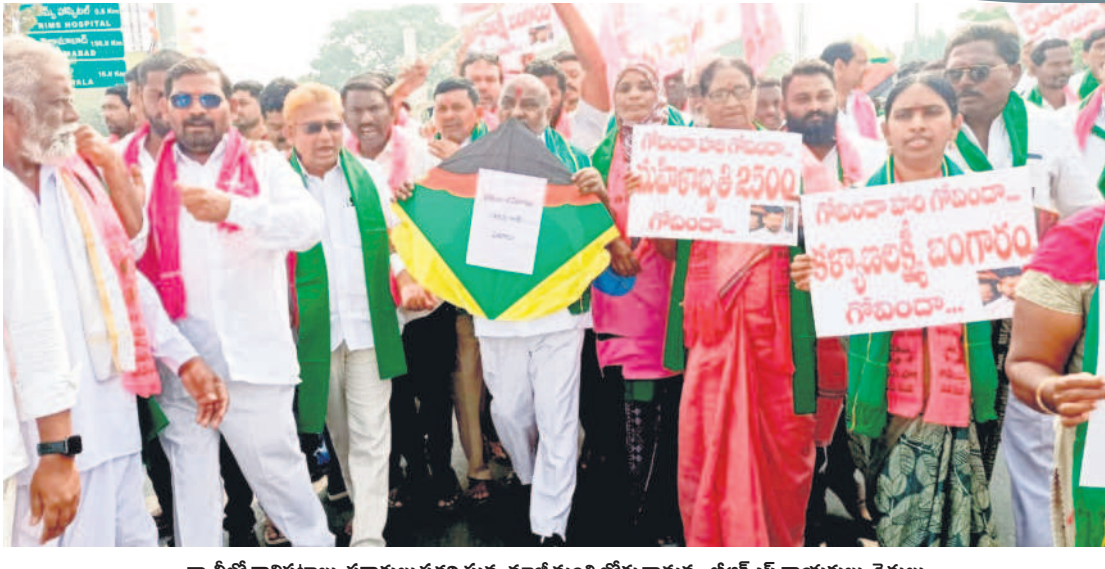
ర్యాబీలో గావిపటాలు, షకార్లు ప్రదర్శిస్తున్న మాజీ మంత్రి జోగు రామన్న, జీఆర్ఎస్ నాయకులు, రైతులు