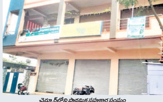
చెన్నూర్ లోని ప్రాథమిక సహకార సంఘం

చెన్నూర్ వీధి వీధి సాస్టిలో 635 మంది రైతులకు రూ. 2 లక్షల లోపు రుణం తీసుకున్నవాళ్ళు 626 మంది. వీరిలో రుణమాఫీ అయిందోళ్ళు కేవలం 197 మంది. రూ. 2 లక్షల లోపు రుణాలు రూ. 4.64 కోట్లు ఉండగా, కేవలం రూ. కోటి మాత్రమే మాఫీ అయ్యింది.