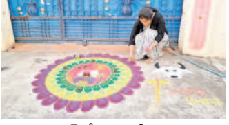
హుస్సాబాద్లో ముగ్గు వేస్తున్న యువతి