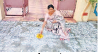
హుస్సాబాద్లో ముగ్గు వేస్తున్న మహిళ