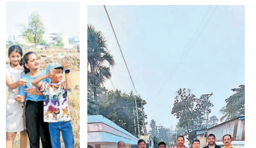
పతంగులను ఎగురవేస్తున్న చిన్నారులు