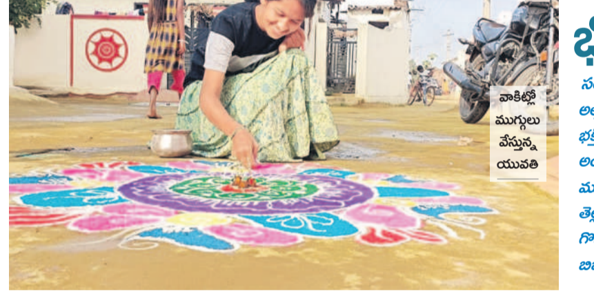
వాకిట్లో ముగ్గులు వేస్తున్న యువతి