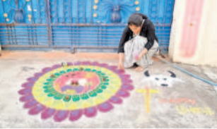
హుస్సాబాద్లో ముగ్గు వేస్తున్న యవతి