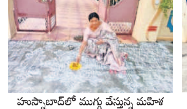
హుస్సాబాద్లో ముగ్గు వేస్తున్న మహిళ