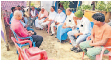
మోతాలో మృతుడి కుటుంబ సభ్యులను పరామర్శిస్తున్న సోలిపేట సతీశ్రేణి