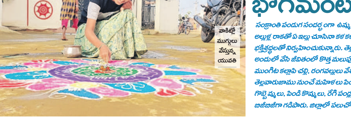
వాకిట్లో ముగ్గులు వేస్తున్న యువతి