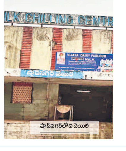
షాద్ నగర్ లోని డెయిరీ