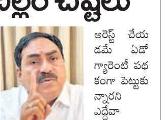
అర్జీ చేయడమే ఏదో గ్యారంటీ పథకమా?

దేవరపల్లె, జనవరి 15: బీఆర్ఎస్ నేతల అర్జీపై దృష్టిని వేసినట్లుగానే సీఎం కేసీఆర్ అర్జీలపై పీఠిక చేస్తున్న విచిత్ర చర్యలను ప్రజలు ఎవరికొకరు అర్థం చేసుకోవలేకపోతున్నారు. కాంగ్రెస్ ఫిరాయింపు రాజకీయాలను ప్రశ్నించిన బీఆర్ఎస్ అర్జీపై పాడి కౌశిక్ రెడ్డిని అక్రమంగా అరెస్టు చేయడం దురాచారమని ఒక ప్రకటనలో ఆరోపించారు. డైరెక్టర్ రాజకీయాలు చేస్తున్న రేవంత్ రెడ్డి బీఆర్ఎస్ నేతలను