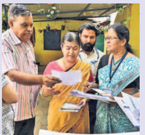
కులగణనతో రేషన్ కార్డుకు లింకా?

మొదటిపేజీ తరువాయి... అర్జున్ తేజువే ముఖ్యమంత్రి సర్వే చేయించారని విమర్శలు న్నాయి. ప్రజల నుంచి సేకరించిన వివరాలతో కూడిన పాలిటా రోడ్లపై దర్యాప్తులు చేపట్టారు. కులగణనలో పాల్గొనాలని, వివరాలు ఇవ్వాలన్న ప్రభుత్వ పథకం మాత్రం సర్వేకు దూరంగా ఉన్నట్లు తెలిసింది. చాలా మంది ప్రజలు, ఎమ్మెల్యేలు, ఎంపీలు, శ్రీలక్ష్మణ్ కుమార్ల వంటివారు సర్వేలో పాల్గొనలేదని ప్రచారం జరిగింది. ఈ సర్వేకు ప్రామాణికత ఎక్కడినో ప్రశ్నలు వినిపిస్తున్నాయి.