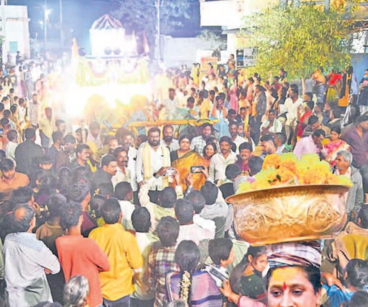
జనవోలులో పెద్ద బండీతో వస్తున్న మామిడి పండ్లు