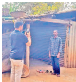
వెంకటాపురం జిల్లీ లక్ష్మీపురంలో సర్వే చేస్తున్న అధికారులు

బయ్యారం, జనవరి 15 : బయ్యారం మండలం వెంకటాపురం, అల్లిగూడెం పంచాయతీలో ఇందిరమ్మ ఇళ్ల సర్వే ప్రారంభమైంది. ఇందిరమ్మ ఇళ్ల సర్వే యాప్ లో ఈ రెండు గ్రామ పంచాయతీల్లోని ఎనిమిది గ్రామాలు లాగిన్ కాకపోవడంతో సర్వే మొదలుకాలేదు. ఈ క్రమంలో ప్రజలు ఆందోళన చెందుతున్న తీరుపై 'ఇందిరమ్మ ఇళ్ల యాప్'.. ఆ ఊళ్లు మిన 'శిర్డి కన ఈ నెల 8న 'నమస్తే తెలంగాణ'లో కథనం ప్రచురించింది. దీంతో స్పందించిన జిల్లా యంత్రాంగం అధికారుల దృష్టికి తీసుకెళ్లడంతో సాంకేతిక సమస్యను పరిష్కరించి బుధవారం ఆయా గ్రామాల్లో సర్వే నిర్వహించారు.