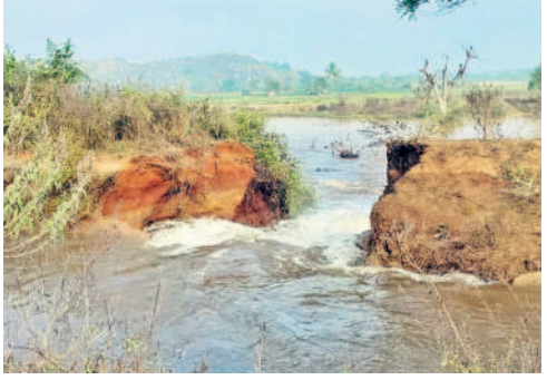
వ్యూహా పోతున్న నీళ్లు

ఇనుగర్ల, జనవరి 15 : ఇనుగర్ల మండలంలోని మిత్రవర్షం గ్రామ పంచాయతీ పరిధిలోని మురికుంటితండా సమీపంలో మంగళవారం ఎస్సారెస్పీ కెనాల్ కాలువకు గండి పడింది. భారీగా నీళ్లు పూర్ణ పోవడంతో అధికారులు నీటి సరఫరా నిలిపివేశారు. అయితే వెంటనే గండిని పూర్ణ తిరిగి నీళ్లు అందించాలని లేకపోతే తమ పంటలు ఎండిపోతాయని రైతులు ఆవేదన వ్యక్తం చేశారు. కాలువలో ఉన్న చెత్తాచెదారం, చెత్తకొమ్మల లాంటివి తొలగించడపోవడం వల్లే తరచూ ఎస్సారెస్పీ కెనాల్ కు గడ్డు పడుతున్నాయని రైతులు