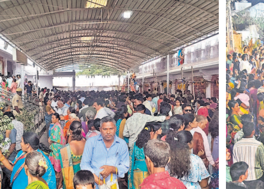
కొత్తకొండ ఆలయంలో కిక్కిరిసిన భక్తులు

కాలింగ్ వ్యవస్థ లేదు కొత్తగా ఏర్పాటు చేసిన డ్రగ్ స్టోర్లలో మందులను నిల్వ చేసే వ్యవస్థ అధ్వానంగా ఉన్నది. మందులను నిల్వ చేసే ఉష్ణోగ్రత(కూలింగ్) నిర్వహణ లేదు. దీంతో మందులు నాశనమవుతున్నాయి. ముఖ్యంగా 0 నుంచి 8 సెంటీగ్రేడ్ ఉష్ణోగ్రతలో నిల్వ ఉంచాల్సిన వ్యాక్సిన్లు జిల్లా డ్రగ్ స్టోర్లకు రావడం లేదు. వీటి వ్యవస్థలో నిల్వ చేయాలిన్ యాంటీబయోటిక్ మందులు ఉండడం లేదు. డ్రగ్ స్టోర్లలో నిల్వ సామర్థ్య వ్యవస్థ లేకపోవడంతో ఈ పరిస్థితి నెలకొన్నది. అంతేకాక సరఫరా చేసిన వాహనాలు బిల్లు