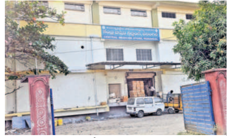
వరంగల్ లోని కేంద్ర బెజ్జెడ్ గిడ్డంగి

వరంగల్, జనవరి 15 (నమస్తే తెలంగాణ ప్రతినిధి) : ప్రభుత్వ దవాఖానలకు మందుల సరఫరా ప్రక్రియ గండరగోళంగా మారింది. సింట్లో డ్రగ్ స్టోర్ నుంచి ప్రాథమిక ఆరోగ్య కేంద్రాలకు బెజ్జెడలు చేరవేసే వ్యవస్థ గాడి తప్పింది. ఫలితంగా ప్రజలకు అవసరమైన మందులు సకాలంలో అందక ఇబ్బంది అవుతున్నది. ప్రభుత్వ దవాఖానల్లో అత్యవసరం మందుల కొరత ఉంటున్నది. పీహెచ్సీలకు అవసరమైన వ్యాక్సిన్లు, యాంటీబయోటిక్ వంటి అత్యవసరం మందులు అందడం లేదు. చిన్న పిల్లలకు ప్రతినెలా ఇచ్చే వ్యాక్సిన్లు పీహెచ్సీల్లో అందుబాటులో ఉండడం లేదు. గ్రామీణ ప్రాంతాల్లో వైద్యుని వల అందించే పీహెచ్సీ సిబ్బంది స్వయంగా సింట్లో డ్రగ్ స్టోర్ కు వెళ్లి మందులు తీసుకుపోవాల్సి వస్తున్నది. రెండు, మూడు రోజులకు ఒకసారి ఇలా డ్రగ్ స్టోర్ కు వెళ్లడం, అటు పీహెచ్సీలో సేవందించడం.. ఇలా రెండు రకాల పనులతో పీహెచ్సీలో ఆశించిన మేరకు వైద్యం అందని పరిస్థితి నెలకొంది. పీహెచ్సీల్లో మందుల కొరత సమస్య రోజురోజుకూ తీవ్రమై రోగులకు శాశ్వతం మారు తప్పదు.