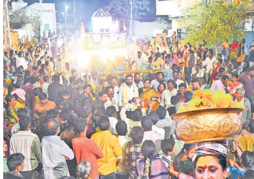
ఐనవోలులో పెద్ద బండితో వస్తున్న మాల్వేని పంపియలు