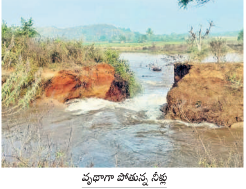
వ్యూహా పోయిన నీళ్లు

ఇనుగర్ల, జనవరి 15 : ఇనుగర్ల మండలంలోని మిత్రవేదం గ్రామ పంచాయతీ పరిధిలోని మురికుంటితండా సమీపంలో మంగళవారం ఎస్సారెస్పీ కెనాల్ కాలువకు గండి పడింది. భారీగా నీళ్లు పూర్ణ పోవడంతో అధికారులు నీటి సరఫరా నిలిపివేశారు. అయితే వెంటనే గండిని పూర్ణ తిరిగి నీళ్లు అందించాలని లేకపోతే తమ పంటలు ఎండిపోతాయని రైతులు ఆవేదన వ్యక్తం చేశారు. కాలువలో ఉన్న చెత్తాచెదారం, చెట్లకొమ్మల లాంటివి తొలగించడపోవడం వల్లే తరచూ ఎస్సారెస్పీ కెనాల్ కు గండ్లు పడుతున్నాయని రైతులు