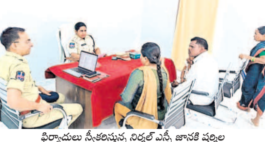
పిర్నాడులు స్వీకరిస్తున్న నిర్మల ఎస్పీ జానకి వల్లెల

జైన్‌గి, జనవరి 15 : పెండింగ్లో ఉన్న కేసులు వెంటనే పరిష్కరించేలా చూడాలని నిర్మల ఎస్పీ జానకి వల్లెల అన్నారు. బుద్ధవారం నిర్మల జిల్లా జైన్‌గిలోని క్యాంపు కార్యాలయంలో ప్రజాఫిర్యాదుల విభాగం నిర్వహించిన పిర్నాడుల అధ్యయన తక్షణమే పరిష్కారం కోసం సంబంధిత స్టేషన్ సీఐ, ఎన్ఐలకు సమన్లు స్థితిపరిష్కారానికి సూచనలు చేయడం జరిగిందన్నారు. ప్రజలు నిర్మలలో మూడవ వ్యక్తి ప్రయోగం, ఎలాంటి పైరవీలు లేకుండా పోలీసు సేవలను వినియోగించుకుంటూ పరిష్కరించుకునేలా చూస్తున్నామన్నారు. శాంతి భద్రతలను పరిష్కరిస్తూ ముందుకు నాగడమ్ లక్ష్యంగా జిల్లా పోలీసు శాఖ పని చేస్తుందన్నారు. కార్యక్రమంలో ఎమ్మెల్యే అనిల్ కుమార్, సీఐలు, పోలీసు సిబ్బంది పాల్గొన్నారు.