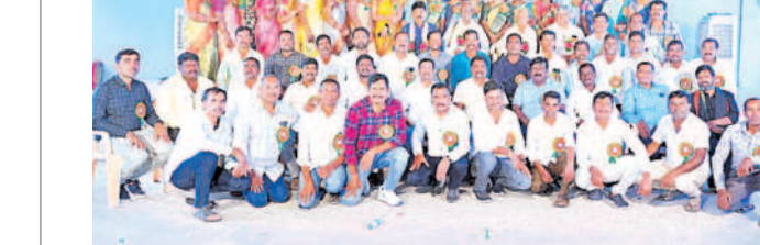
జిల్లా పరిషత్ ఉన్నత పాఠశాల 2001-02 సంవత్సరం పూర్వ విద్యార్థులు

ఇల్లంతకుండా, జనవరి 15: మండల లంలోని జంకెండ్లపల్లి గ్రామంలో మూడు రోజులుగా జరుగుతున్న జాతర ఉత్సవాల్లో మద్యం తాగి డ్రైవ్ చేస్తే చర్యలు తప్పవని ఎస్సీ కలిపి కలిపి కలిపి కలిపి గౌడ్ బుడవారం హెచ్చరించారు. జాతర ఉత్సవాల్లో భక్తులకు ఎలాంటి అపాయనం కలిగించినా చర్యలు తప్పవన్నారు. జాతర ఉత్సవాలకు వచ్చే భక్తులకు ఎలాంటి ఇబ్బందులు కలగకుండా గట్టి బందోబస్తు ఏర్పాటు చేశామన్నారు.