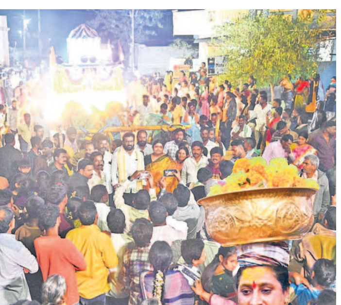
బనవోలులో పెద్ద బండితో వస్తున్న మాల్వేని పంపిణీలు