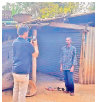
వెంకటాపురం జిల్లీ లక్ష్మీపురంలో సర్వే చేస్తున్న అధికారులు