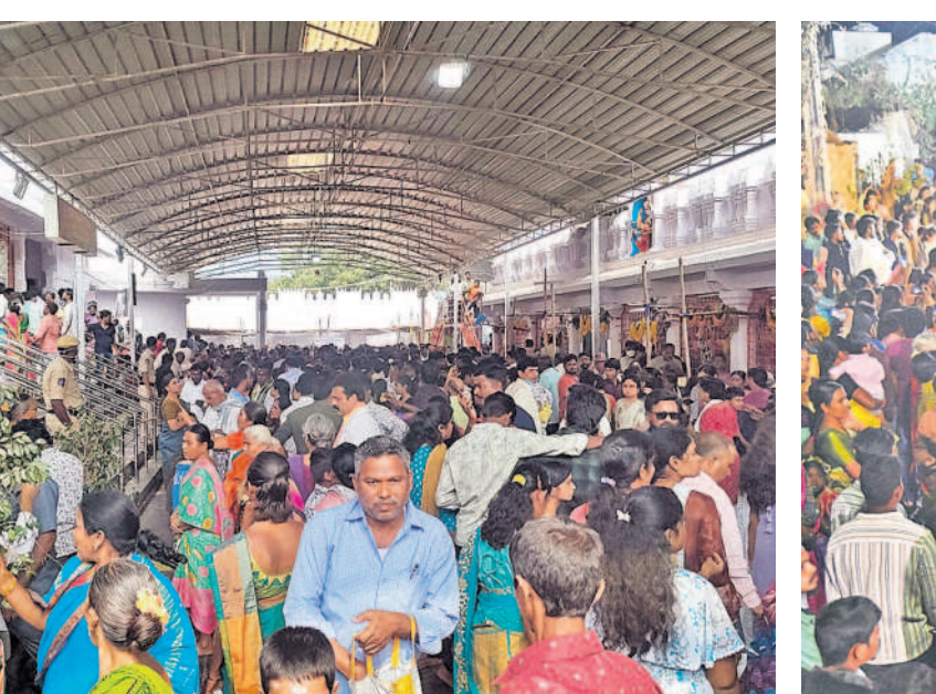
కొత్తకొండ ఆలయంలో కీర్తనలను భక్తులు

కాలింగ్ వ్యవస్థ లేదు కొత్తగా ఏర్పాటు చేసిన డ్రగ్ స్టోర్లలో మందులను నిల్వ చేసే వ్యవస్థ అధ్వానంగా ఉన్నది. మందులను నిల్వ చేసే ఉష్ణోగ్రత(కూలింగ్) నిర్వహణ లేదు. దీంతో మందులు నాశనమవుతున్నాయి. ముఖ్యంగా 0 నుంచి 8 సెంటీగ్రేడ్ ఉష్ణోగ్రతలో నిల్వ ఉంచాల్సిన వ్యాక్సిన్లు జిల్లా డ్రగ్ స్టోర్లకు రావడం లేదు. వీటి వ్యవస్థను నిర్వహించే యాంటీబయోటిక్ మందులు ఉండడం లేదు. డ్రగ్ స్టోర్లలో నిల్వ సామర్థ్య వ్యవస్థ లేకపోవడంతో ఈ పరిస్థితి నెలకొన్నది. అంతేకాక సరఫరా చేసిన వాహనాలు బిల్లు