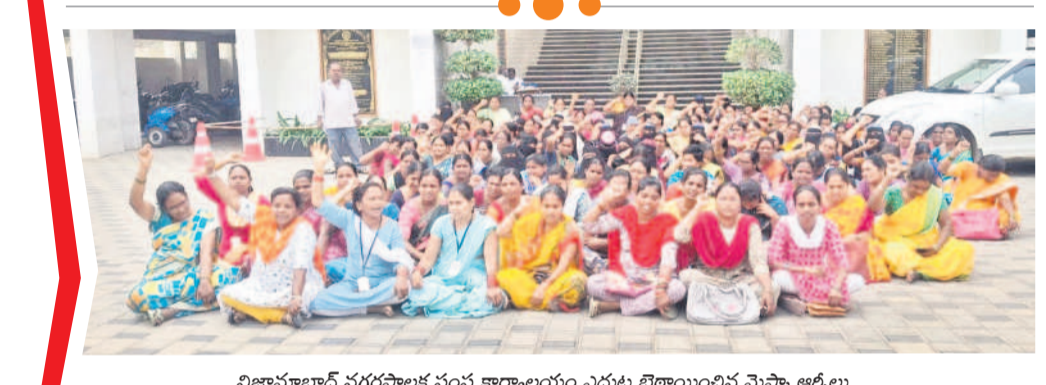
నిజామాబాద్ నగరపాలక సంస్థ కార్యాలయం ఎదుట బైరాయిందిన మెప్పా ఆర్టీలు