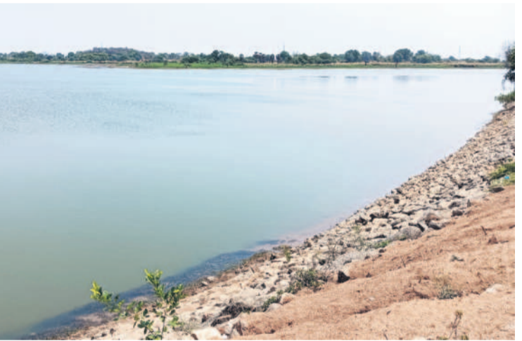
నారాయణపూర్ రిజర్వాయర్ లో తగ్గిన నీటి మట్టం