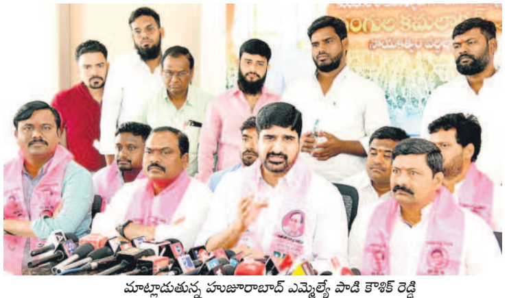
మాట్లాడుతున్న హుజూరాబాద్ ఎమ్మెల్యే పాడి కొశికె రెడ్డి