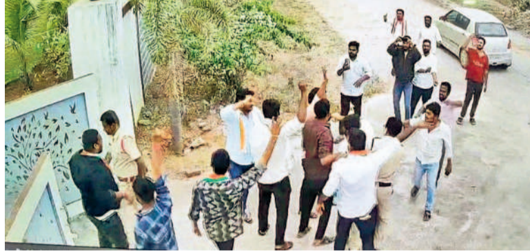
కరీంనగర్ జిల్లా గంగాధర మండలం బూరుగుపల్లిలోని యాత్రిక ఇంటిపై దాడి చేయడానికి వచ్చిన యాత్రిక కాంగ్రెస్ నాయకులు