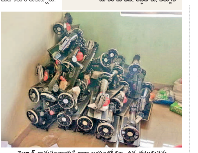
చెల్వూర్ గ్రామపంచాయితీ కార్యాలయంలో నిల్వ ఉన్న కుటుంబీకల పన్నీ