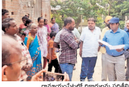
రామాయంపేటలో లిక్కార్లును పరిశీలిస్తున్న కలెక్టర్