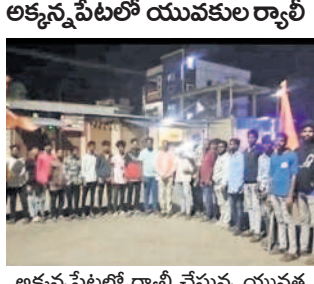
అక్కసేపిటిలో ర్యాలీ చేస్తున్న యువత