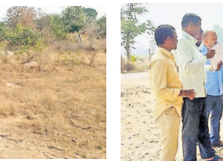
కొడిపల్లి: లింగంపల్లిలో సర్వే నిర్వహిస్తున్న రెవెన్యూ అధికారులు