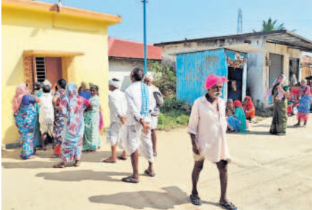
గవ్వలపల్లి పోస్టాఫీసు వద్ద పంచాయతీ కోసం బారులుదీరిన వృద్ధులు, దివ్యాంగులు