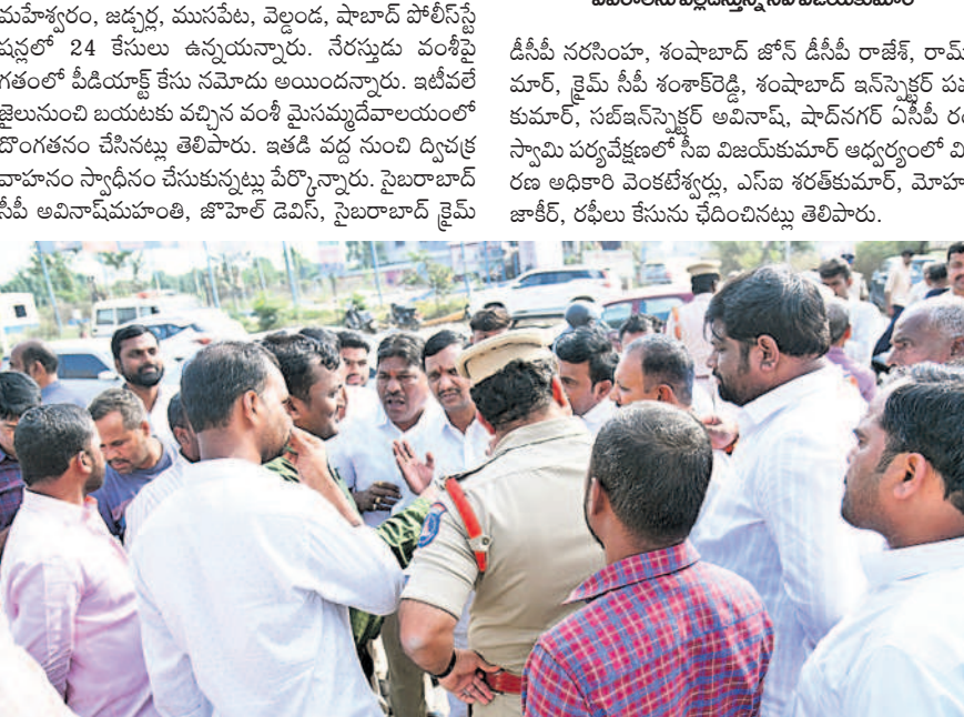
ఎమ్మెల్యే, కమిషనర్ తో బీజేపీ నేతల వాగ్వాదం