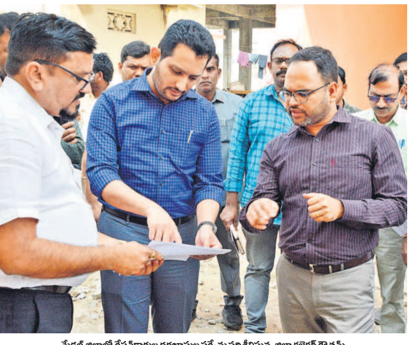
మేడ్చల్ జిల్లాలో రేషన్ కార్డుల దరఖాస్తుల సర్వే పరిశీలనను జిల్లా కలెక్టర్ గౌతం

తలో నియోజకవర్గానికి 3,500 ఇందిరపై ఇండ్లు చొప్పున ఇది నియోజకవర్గాల్లో 17,500 వేల ఇందిరపై ఇండ్ల పథకాన్ని పట్టించుకున్నాయి. లక్షల్లో దరఖాస్తులు రాగా, నియోజక వర్గానికి 3,500లే ఇప్పి మిగతా అర్హులకు రెండు ఏడలలో ఎప్పుడు ఇస్తామన్న దానిపై కాలి రావల్సి ఉంది. ఇందిరపై అత్యంత భరోసా పథకం కింద జిల్లాలో వెయ్యి మందిని ఎంపిక చేయనున్నారు. ఈ పథకాల్లో అర్జులకు ఎంపిక ఈ నెల 21 నుంచి 24 వరకు వార్డు సభలు, గ్రామ సభల్లో జరిగే అధికారులు చర్చలు తీసుకుంటున్నారు.