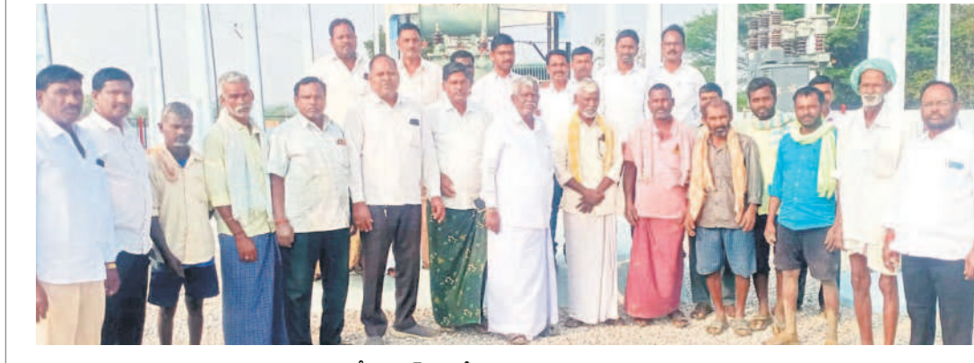
ఏడుగురు విద్యుత్ ఉప కేంద్రం వద్ద నిరసన తెలుపుతున్న రైతులు