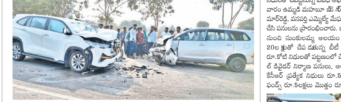
ప్రమాదంలో దెబ్బతిన్న కార్లు