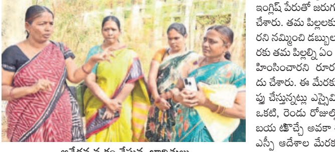
ఆవేదన వ్యక్తం చేస్తున్న బాధితులు