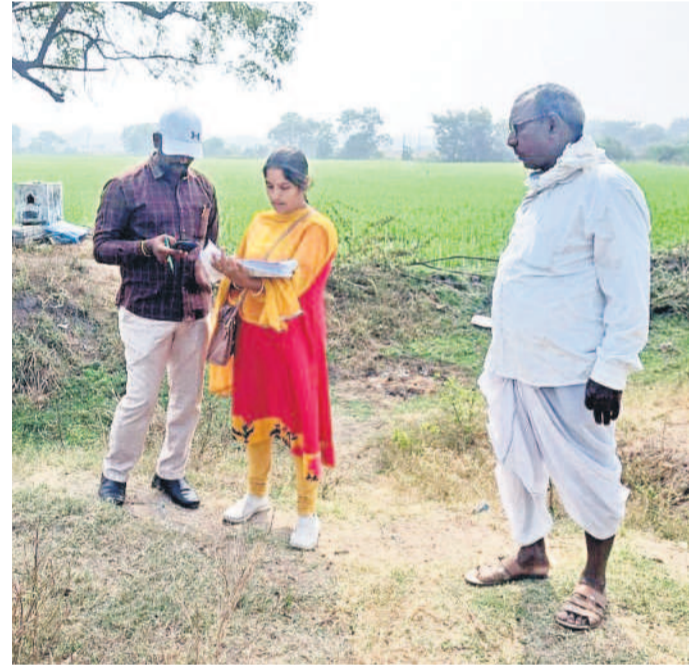
కరీంనగర్ దూరలో: బొమ్మకల్లో సర్వే చేస్తున్న సర్వేయర్, ఏకవేళ వైదీతల్లి

మిగతా భూమి కూడా నాలుగో కిందనే చూపుతున్నట్లు తెలుస్తున్నది. ఇలాంటి వాటిని గుర్తించడంలో అధికారులు వివక్షణ ప్రదర్శించాలి. కానీ, తమదేమీ పొందని ఉన్నది ఉన్నట్లు సూచించే రైతులకు అన్యాయం జరిగి ప్రమాదం ఉన్నది. అంతే కాకుండా సీఎం అర్బన్ ఏరియాలో కూడా కొన్ని క్షణంగా పరిశీలించాల్సిన అవసరమున్నది. మున్సిపాలిటీలో విలీనమైన గ్రామాల్లో దశాబ్దాల క్రితం ఇండ్లు నిర్మించుకున్న రైతులు ఇంటికి అనుకొని ఉన్న భూమిలో వ్యవసాయం చేసుకుంటున్నారు. ఇలాంటి భూముల్లో ఎక్కువగా కూరగాయలు చేస్తున్న భూములను ఏ విధంగా గుర్తించానో సర్వే బృందాలకు బోధించడం లేదు. ఇలాంటివన్నీ క్షణంగా పరిశీలించాలంటే సమయం పడుతుందనే అభిప్రాయం సర్వే బృందాల్లో వ్యక్తమవుతున్నది. ఈ పరిణామాల నేపథ్యంలో ప్రభుత్వం ఒక్కడే మేరకు అధికారులు పైపై సర్వే చేసినట్లుంటే నిజమైన రైతుల అన్యాయం జరిగే పరిస్థితి కనిపిస్తున్నది. దీంతో రైతులు ఆందోళన వ్యక్తం చేస్తున్నారు.