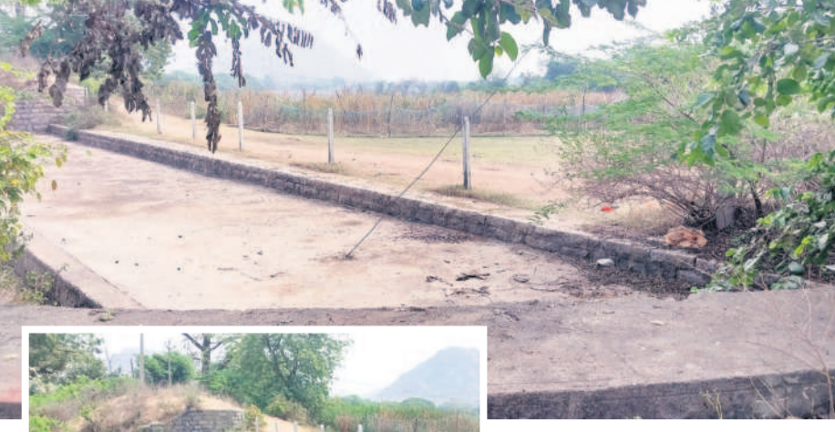
నేడు వెలవెలబోతున్న మన్నెంపల్లి ఊరి పెద్ద చెరువు