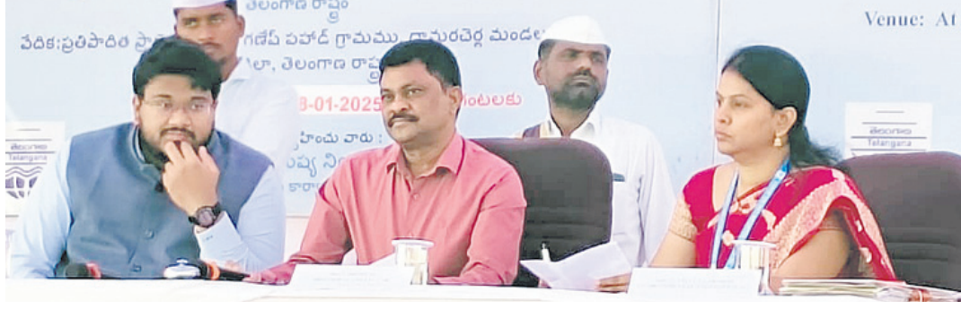
పెన్నా సిమెంట్ కర్మాగారంలో ఏర్పాటు చేసిన ప్రజాభిప్రాయ సేకరణ నిర్వహిస్తున్న అధికారులు