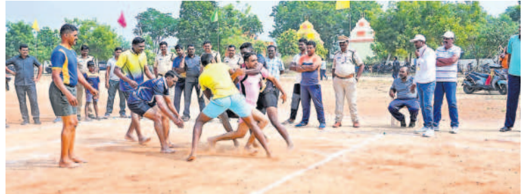
కబడ్డీలో తలదడుతున్న పోలీసులు