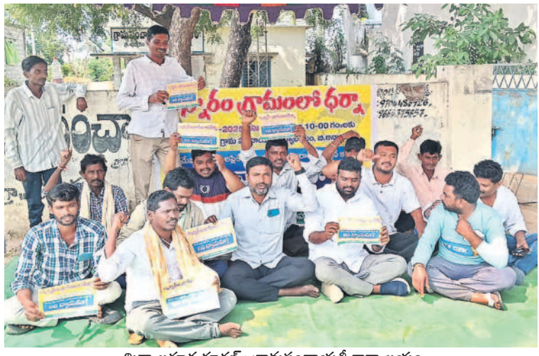
మిర్యాలగూడ రూరల్ : గ్రామపంచాయతీ కార్యాలయం ఆవరణలో భర్తా చేస్తున్న బి.అన్నారం గ్రామస్థులు