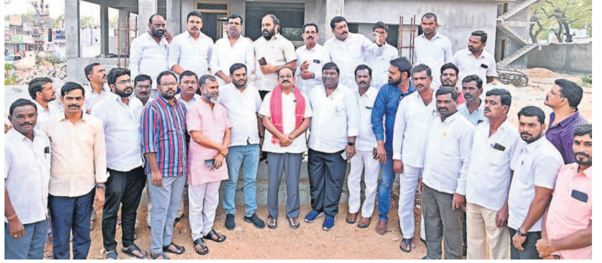
నల్లగొండ క్లాక్ టవర్ సింటర్లో ఏర్పాటుచేసిన పరిశీలిస్తున్న బీఆర్ఎస్ జిల్లా అధ్యక్షులు, మాజీ ఎమ్మెల్యేలు, ముఖ్య నాయకులు