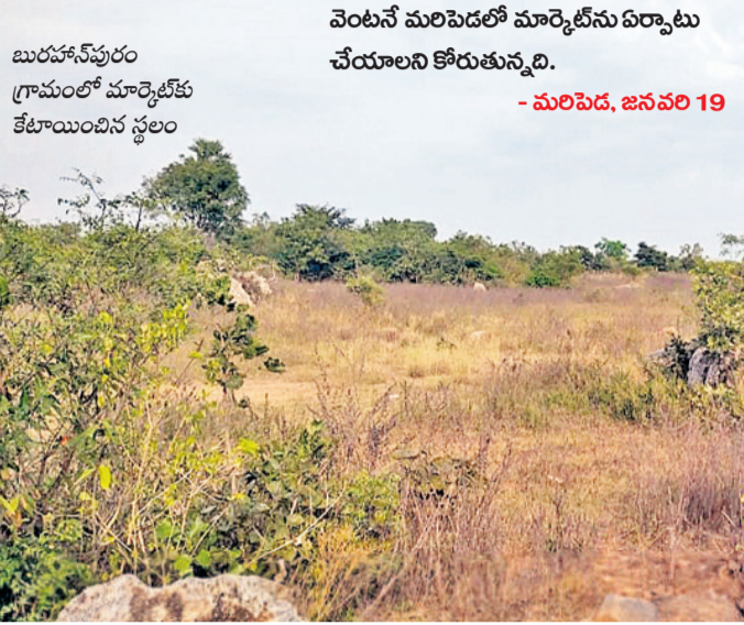
బురహాసీపురం గ్రామంలో మార్కెట్ కేటాయించిన స్థలం

మరిపెడలో వ్యవసాయ మార్కెట్ ఏర్పాటు ప్రతిపాదనలకే పరిమితమైంది. 2020 సంవత్సరంలో బీఆర్ఎస్ హయాంలో ప్రపోజల్స్ పంపగా అప్పటి ప్రభుత్వం బుర హాసీపురం గ్రామ పరిధిలో 9.25 ఎకరాల భూమిని కేటాయించింది. ఆ తర్వాత అధికారంలోకి వచ్చిన కాంగ్రెస్ ప్రభుత్వం వట్టించుకోకపోవడంతో ఎక్కడ వేసిన గొంగళ అక్కడే ఉన్నట్లుంది. వ్యవసాయ ఉత్పత్తుల క్రయవిక్రయాలకు సుమారు 50 కిలోమీటర్ల దూరంలోని కేసముద్రం మార్కెట్ కు వెళ్లి వ్యయ ప్రయాసలకు గురవుతున్నట్లు రైతాంగం ఆవేదన వ్యక్తం చేస్తున్నది. వెంటనే మరిపెడలో మార్కెట్ ను ఏర్పాటు చేయాలని కోరుతున్నది.