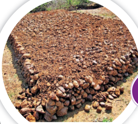
ఇనుప ఖనిజం (ఫైల్)