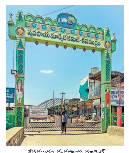
కేసముద్రం వ్యవసాయ మార్కెట్