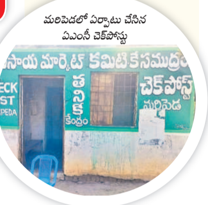
మరిపెడలో ఏర్పాటు చేసిన ఎంపీ చెక్ పోస్ట్