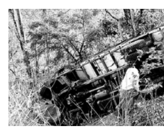
మాల్కంగాడ మూలములుపై పడ్డ బోల్తాపడ్డ డిసీఎం వాహనం

నార్సాద్/ఇంద్రవతి/ఎదులాపురం, జనవరి 19 : ఆదిరాబాద్ జిల్లా గుడిపాత్పూర్ మండలంలో నూర్కొండకు చెందిన ఆదివాసులు 80 మంది వరకు మహారాష్ట్రలోని జుగుబాయి దర్గాహానికి ఆదివారం డిసీఎం వాహనంలో బయలుదేరారు. నార్సాద్ మండలంలోని మాల్కంగాడ మూలములుపై పడ్డ వాహనం ఆదపుతప్పి బోల్తాపడింది. ఈ ఘటనలో 40 మందికి తీవ్ర గాయాలయ్యాయి. క్షతగాతులను తోమ్మిడి ఆంబలి