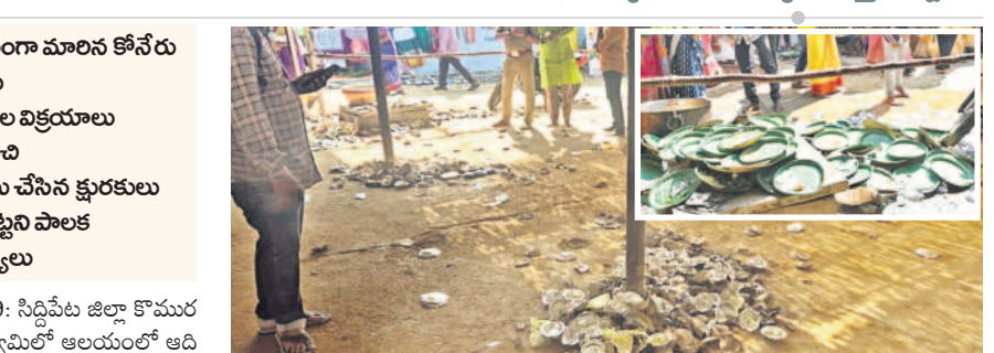
ముల్లన్న క్షేత్రంలో తిని పోసిన స్టాక్స్ పేట్టు

ప్రైవేటు గడువుల రూ.10వేలు వసూలు.. ఆలయ పరిసరాల్లో ఎక్కడవడితే అక్కడ చెత్తకుప్పలు