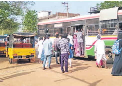
హద్నూర్లో ప్రయాణికులు ఎక్కడెక్కడో వీలు లేకుండా ఉన్న నారాయణపేట డిపో ఆర్టీసీ బస్సు

ప్రయాణికులతో కిక్కిరిసిపోయిన జహీరాబాద్ ఆర్టీసీ బస్టాండ్