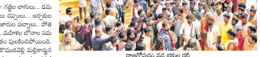
రాజగోపురం వద్ద భక్తుల రద్దీ