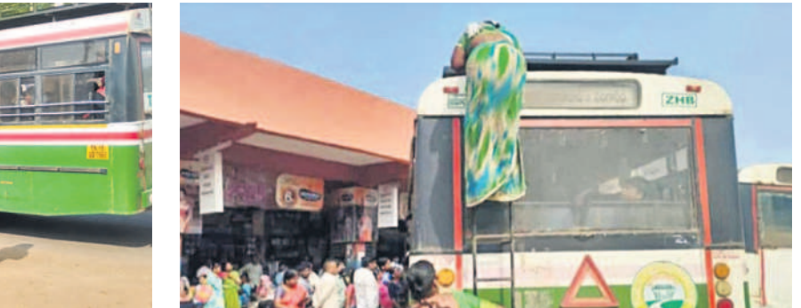
జహీరాబాద్ ఆర్టీసీ బస్టాండ్లో సంగారెడ్డి వెళ్లేందుకు బస్సు టాప్ పై ఎక్కుతున్న మహిళ