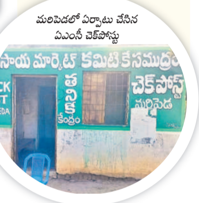
మరిపెడలో ఏర్పాటు చేసిన ఎంపీ చెక్ పోస్టు