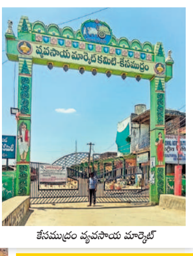
కేసముద్రం వ్యవసాయ మార్కెట్ నివేదిక సిద్ధం చేస్తున్నాం..