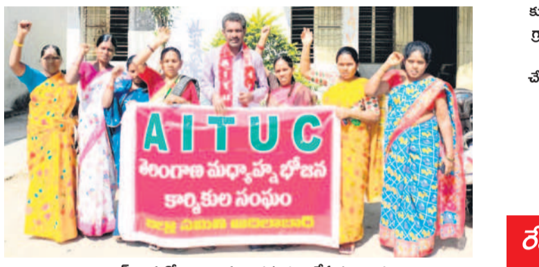
ఆదిలాబాద్ ఎంకావో కార్యాలయం ఎదుట ధర్నా చేస్తున్న కార్మికులు

చికిత్స పొందుతున్న వారితో మాట్లాడుతున్న మాజీ మంత్రి జోగు రామన్న ఆదివాసీ కుటుంబాలను ప్రభుత్వం ఆదుకోవాలి మాజీ మంత్రి జోగు రామన్న ఎదులాపురం, జనవరి 20 : రోడ్డు ప్రమాదంలో మృతిచెందిన, గాయాలైన ఆదివాసీ కుటుంబాలను ప్రభుత్వం ఆదుకోవాలని మాజీ మంత్రి జోగు రామన్న డిమాండ్ చేశారు. నార్మల్ మండలంలో మేట్రో షాలో ఆదివారం ఐదవ వారం బోల్టా పక్ష పుట నలో గాయాలైన వారు రిమ్సలో చికిత్స పొందుతున్నారు. సోమవారం రామన్న