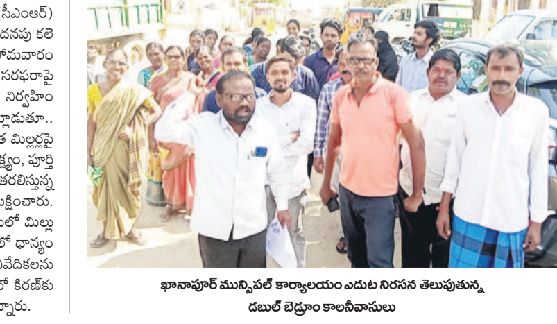
ఖానాపూర్ మున్సిపల్ కార్యాలయం ఎదుట నిరసన తెలుపుతున్న డిమాండ్ బెడ్రాం కాలనీవాసులు

ఎమ్మెల్యే బొజ్జి బోర్లు మేయర్లను మేయర్లను.. అధికారుల దృష్టికి తీసుకెళ్లిన స్పందించడం లేదు.. మున్సిపల్ కమిషనర్ కు వినతి ఖానాపూర్, జనవరి 20 : మున్సిపల్ కార్యాలయం ఎదుట డిమాండ్ బెడ్రాం ఇండ్లలో నివాసం ఉంటున్న పలువురు తాగునీటి సమస్యను పరిష్కరించాలని కోరుతూ సోమవారం నిరసన చేపట్టారు. కొన్ని నెలల నుంచి తాగునీటి సమస్యను పరిష్కరించాలని కోరుతూ సోమవారం నిరసన చేపట్టారు. కొన్ని నెలల నుంచి తాగునీటి సమస్యను పరిష్కరించాలని కోరుతూ సోమవారం నిరసన చేపట్టారు. కొన్ని నెలల నుంచి తాగునీటి సమస్యను పరిష్కరించాలని కోరుతూ సోమవారం నిరసన చేపట్టారు.