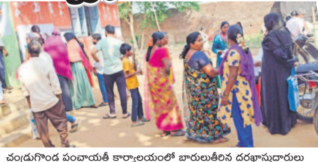
చండ్రుగోడ పంచాయతీ కార్యాలయంలో బారులుతీసిన దరఖాస్తుదారులు

దడవతో వారికి మొండికెయ్యాలి చూపిస్తూ లేక మళ్లీ దరఖాస్తులు పెట్టుకునే అవకాశం ఇచ్చి మద్దతుపడతారా అనే ప్రచారం జోరుగా సాగుతున్నది. సర్వేలో పనిచేస్తున్న ప్రభుత్వం ఈ నాలుగు పథకాలను అమలు చేయడం కష్టమేనని, కాంగ్రెస్ ప్రభుత్వంపై తమకు నమ్మకం లేదని ప్రజలు అసహనం వ్యక్తం చేస్తున్నారు. నేటినుంచి నాలుగు రోజులపాటు.. ప్రజాపాలనలో సైతం ప్రతిఘటన వద్ద దరఖాస్తులను స్వీకరించి ఇప్పటికే వారిలో ఒక్కరిని చారు. రైతుభరోసా, ఇందిరమ్మ ఇళ్ల, రైతుభరోసా, అదనపు ఆర్డీయూ భరోసా, కొత్త రేషన్ కార్డులు ఇచ్చేందుకు అర్బులను గుర్తించనున్నారు. ఇంకా కోసం మంగళవారం నుంచి నాలుగు రోజులు జరిగే గ్రామసభల్లో అర్బుల జాబితాను ప్రదర్శించనున్నారు. ఇంతచేసినా అర్బులు ఇంకా చాలామంది ఉండడం