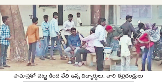
సామాన్లతో చెట్టు కింద వేచి ఉన్న విద్యార్థులు, వారి తల్లిదండ్రులు

మలాయపాలెం సోషల్ వెల్ఫేర్ గురుకులానికి తరగతుల్లోకి వెళ్లేందుకు ఉన్న గ్రేడ్ల తాళం నెలల కరెంట్ బకాయిలు వీరుతున్నారంటూ అధికారులు స్పందించారు. అధికారులు మాత్రమే రావడంతో వారిని గ్రాండ్ ఫోర్లోనే ఉంచారు. అధికారులు కూడా విద్యార్థులు రావాలి. నెలపుల అసలకు వెళ్లేందుకు వీలులేకుండా తాళం వేశారు. గురుకులం కళాశాల ప్రెస్టాలో, సిబ్బంది విజ్ఞప్తి చేయడంతో గేట్లకు తాళం ఉపసంహరించారు.