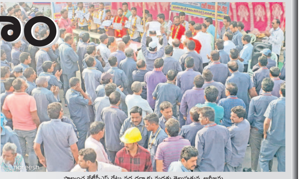
పాల్వంచ కేటీపీఎస్ గేటు వద్ద ధర్నాకు మద్దతు తెలుపుతున్న ఆర్టిజన్లు

విద్యుత్ అభివృద్ధి కార్యక్రమాలను కనీసం చేయాలని డిమాండ్ చేస్తూ పాల్వంచ కేటీపీఎస్ గేటు ఎదుట, లక్ష్మీదేవిపల్లిలోని విద్యుత్ శాఖ భద్రాద్రి కొత్తగూడెం జిల్లా సర్కిల్ కార్యాలయం వద్ద ఆర్టిజన్ల యూనియన్ ఆధ్వర్యంలో ఆర్టిజన్ల ధర్నా చేశారు. ఈ సందర్భంగా యూనియన్ నాయకులు మాట్లాడుతూ.. జేపీసీ రాష్ట్ర కమిటీ పిలుపు మేరకు ఈ నెల 20 నుంచి 24 వరకు రిలే డిక్షన్లు చేస్తున్నట్లు చెప్పారు. ట్రాన్సిమిషన్, జెనెకోల్లో పనిచేస్తున్న 20 వేల మంది ఆర్టిజన్ల కార్యకర్తలను కన్వర్షన్ చేయాలని డిమాండ్ చేశారు. రేకుంటే విద్యుత్ సరఫరాను స్పందింపజేస్తామని ప్రభుత్వాన్ని హెచ్చరించారు. అలాగే సీపీఐ ఆధ్వర్యంలో జూలూరుపాడులో తహసీల్దార్ కార్యాలయం ఎదుట ధర్నా నిర్వహించారు. ఈ నెల 21 నుంచి మూడు రోజుల పాటు నిర్వహించే గ్రామ సభల్లో దరఖాస్తు చేసుకున్న అర్బులందరికీ రేషన్ కార్డులు, ఇందిరమ్మ ఇళ్ల ఇవ్వాలని; రైతుభరోసా, ఇందిరమ్మ ఆర్డీయూ భరోసా పథకాలను వర్తింపజేయాలని డిమాండ్ చేశారు. అలాగే, జూలూరు పాడు ఎంకావో కార్యాలయం ఎదుట ఏజిటీషన్ల ఆధ్వర్యంలో మద్యాహ్నం భోజన కార్యక్రమం ధర్నా చేశారు. మద్యాహ్నం భోజన పథకం బిల్లులను వెంటనే విడుదల చేయాలని, పెరిగిన ధరలకు అనుగుణంగా కోడిగర్రలు, బిల్లులు ఇవ్వాలని డిమాండ్ చేశారు. అలాగే, మున్సిపాలిటీలోని ఇందిరమ్మ ఆర్డీయూ భరోసా పథకాన్ని వర్తింపజేయాలని డిమాండ్ చేస్తూ సీపీఎం ఆధ్వర్యంలో