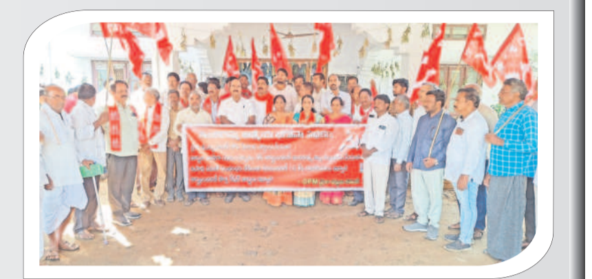
పట్టణ పేదలకు ఇందిరమ్మ ఆర్డీయూ భరోసా వర్తింపజేయాలంటూ నిర్మాణ ధర్నా చేస్తున్న నేతలు