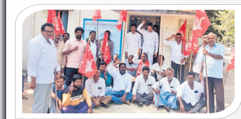
జూలూరుపాడు: అర్బులకు పథకాలు వర్తింపజేయాలంటూ తహసీల్ ఎదుట ధర్నా చేస్తున్న నేతలు