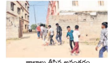
తాళాలు తీసిన అనంతరం లోపలికి వెళ్తున్న విద్యార్థులు

మలాయపాలెం సోషల్ వెల్ఫేర్ గురుకులానికి తరగతుల్లోకి వెళ్లేందుకు ఉన్న గ్రేడ్ల తాళం నెలల కరెంట్ బకాయిలు వీరుతున్నారంటూ అధికారులు స్పందించారు. అధికారులు మాత్రమే రావడంతో వారిని గ్రాండ్ ఫోర్లోనే ఉంచారు. అధికారులు కూడా విద్యార్థులు రావాలి. నెలపుల అసలకు వెళ్లేందుకు వీలులేకుండా తాళం వేశారు. గురుకులం కళాశాల ప్రెస్టాలో, సిబ్బంది విజ్ఞప్తి చేయడంతో గేట్లకు తాళం ఉపసంహరించారు.