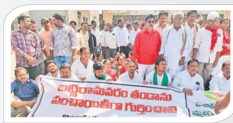
బిట్టి రామవరం తండాను కార్పొరేషన్లో కలపాద్దంటూ కలెక్టర్ వద్ద ఎదుట ధర్నా చేస్తున్న నాయకులు