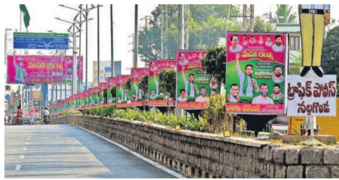
నల్లగొండలో రైతు మహాధర్మా సందర్భంగా బీఆర్ఎస్ పార్టీ చేసిన ఏర్పాట్లు