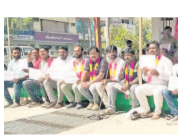
కరీంనగర్ సర్కార్ కార్యాలయం ఎదుట లిలే నిరాహార దీక్ష చేస్తున్న అర్జిజన్ కార్మికులు

కాంగ్రెస్ ప్రభుత్వం ₹500కు సిలిండర్ ఇస్తామని ప్రకటించిన కారణంగా ఆగమై తిరుగుతున్న డబ్బులు బ్యాంకులో పడాలంటే మండల ఆఫీసరుకు పామ్మని గ్యారన్టీ కంపెనీ వాళ్లు అంటున్నారు. మండల ఆఫీసరు పోతే అదేండ్ అయితేలేదు అంటున్నారు. నాకు సక్కువ తెలుపమ. ఎవరికి చెప్పినా పట్టింతు కుంటు లేరు. నేను ఎవరికి చెప్పకపోయి..? ఎటు తిరగలేక చెప్పలేక ఉంటున్నా. గ్యారన్టీ పైసలు రావు. మనస్సు పైసలు రావు. అంత ఉత్తమ ముచ్చటే సారీ.