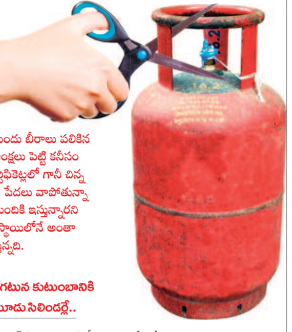
సగటున కుటుంబానికి మూడు సిలిండర్లు..

సబ్సిడీ సిలిండర్ అటకెక్కుతున్నది. మహాఅక్షి పథకంలో ₹500కే అందిస్తామని ఎన్నికల ముందు బీరాలు పలికిన కాంగ్రెస్ సర్కారు, తీరా గెలిచిన తర్వాత తుస్సుమనిపిస్తున్నది. అనేక కొర్రలు, సహజ అంక్షలు పెట్టి కనీసం 50 శాతం మందికి కూడా రాయితీ ఇవ్వడం లేదని తెలుస్తున్నది. అయితే అక్టోబర్ 31, సబ్సిడీ ఇచ్చేందుకు గానీ చిన్న అక్షర డోషం ఉన్నా రిజెక్ట్ చేస్తున్నదని, కార్యాలయాల మట్లా తిరగలేక అలసిపోతున్నామని పేదనా పోతున్నాయని యంత్రాంగం నుంచి సరైన స్పందన కరువుపడుతున్నది. అయితే లబ్ధిదారులు లెక్క ఎంతమందికి ఇస్తున్నారని అడిగితే తమకు తెలియదనడం, వివరాలు అత్యంత గోప్యంగా ఉంచడం, హైదరాబాద్ స్టాయిలోనే అంతా జరుగుతున్నదని అధికారులు చెబుతుండడం అనేక అనుమానాలకు తావిస్తున్నది.