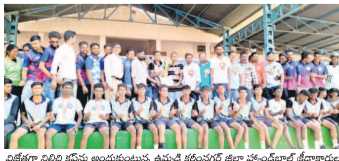
విజేతగా నిలిచి కమన్ అందుకుంటున్న ఉమ్మడి కరీంనగర్ జిల్లా హ్యాండ్ బాల్ క్రీడాకారులు