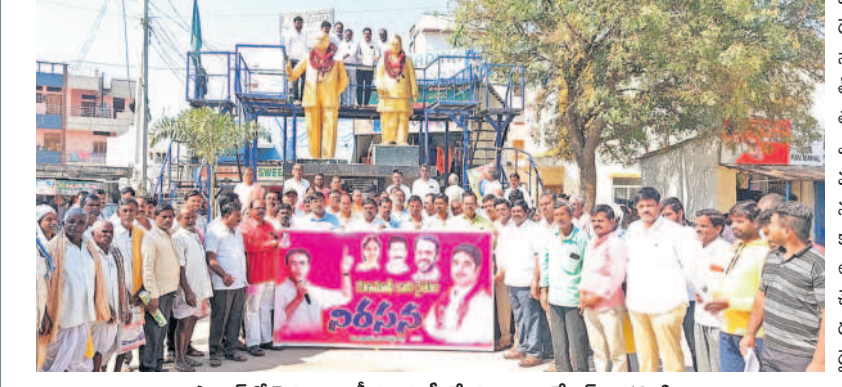
షాబాద్ లో రైతులందరికీ రుణమాఫీ చేయాలని అంబేద్కర్ విగ్రహానికి వినతి పత్రాన్ని అందజేస్తున్న బీఆర్ఎస్ శ్రేణులు