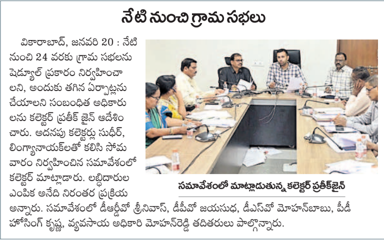
నేటి నుంచి గ్రామ సభలు