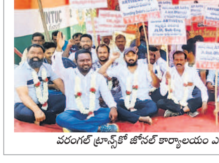
వరంగల్ ట్రాన్స్కో జోన్లో కార్యాలయం ఎదుట బీజేపీ వచ్చున్న అర్ధజన్మ కార్మికులు

రాల్చిని గతంలోనే డిప్యూటీ సీఎం భట్టి విక్రమార్య, ట్రాన్స్కో సీఎండిలను కలిపి వినితీ పత్రాలను సైతం అందజేశారు. అదేవిధంగా ఫిబ్రవరి 3 నుంచి 13వ తేదీ వరకు కన్వర్షన్ యాక్, 20వ తేదీన హైదరాబాద్లో చలో విద్యుత్ సాధన నిర్వహిస్తున్నామని తెలిపారు. ఇందులో అర్ధజన్మ అందరూ పాల్గొంటారని, అప్పుడు విద్యుత్ సంస్థ కుసుకూలో ప్రమాదం ఉంటుందని హెచ్చరించారు. కార్యకర్తలను బట్టి జూనియర్ లైసెన్స్, జూనియర్ అసిస్టెంట్, ఆఫీస్ సబ్సిడియరీ లేదా అటెండర్, సబ్ ఇంజినీర్ పోస్టులు ఇవ్వాలని డిమాండ్ చేశారు. తమ న్యాయమైన డిమాండ్లను నెరవే