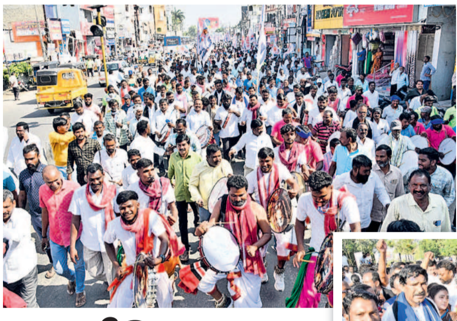
దడుగువచ్చుతో రాల్చిగా వచ్చున్న ఎమ్మెల్యేపర్ కార్యకర్తలు, మాదిగలు

నిరుద్యోగ మహిళలకు ఉచిత శిక్షణ హనుమకొండ, జనవరి 20 : భారతీయ స్టేట్ బ్యాంక్ గ్రామీణ స్వయం ఉపాధి శిక్షణా సంస్థ నిరుద్యోగ మహిళలకు బ్యూటీషియన్ కోర్సులో (30 రోజులు) శిక్షణ ఇవ్వనున్నట్లు డైరెక్టర్ బాస రవి ఒక ప్రకటనలో తెలిపారు. ఉమ్మడి వరంగల్ జిల్లా వారు దరఖాస్తు చేసుకోవాలన్నారు. వయసు 18-45 ఏండ్లలోపు ఉండాలన్నారు. తెల్ల రేషన్ కార్డు వారు 4 పోలీస్, అధికారి కార్డు, విద్యార్థక జిర్కా కాపీలతో హనుమకొండ సంస్కృతి విభాగంలోనే బీటీడీలో 24లోగా పేర్లు నమోదు చేసుకోవాలన్నారు. వివరాలకు 9704056522, 9849307873, 6281260878, 9949108934 సంబంధం ఉండాలన్నారు.