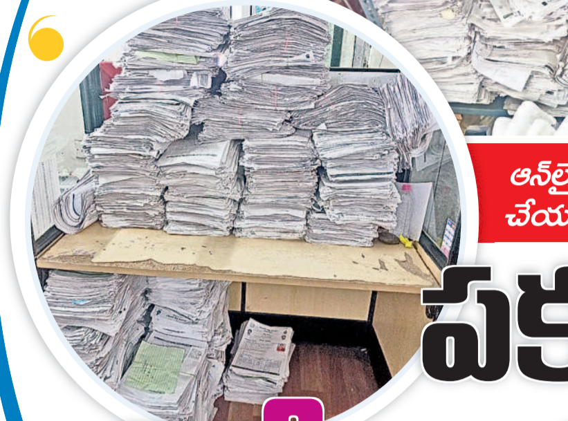
ఆన్లైన్లో నమోదు చేయకుండా గ్రేటర్ వరంగల్ మున్సిపల్ కార్పొరేషన్లో ౬ గదిలో ఉంచిన ప్రజాపాలన దరఖాస్తులు