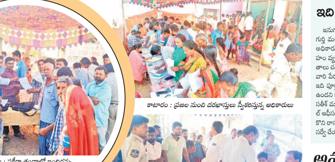
నర్సంపేట : ఫకీరా తండాలో ఇందిరమ్మ ఇండ్ల సర్వే మళ్లీ చేపట్టాలని వినవేత్రం ఇస్తున్న గ్రామస్థులు