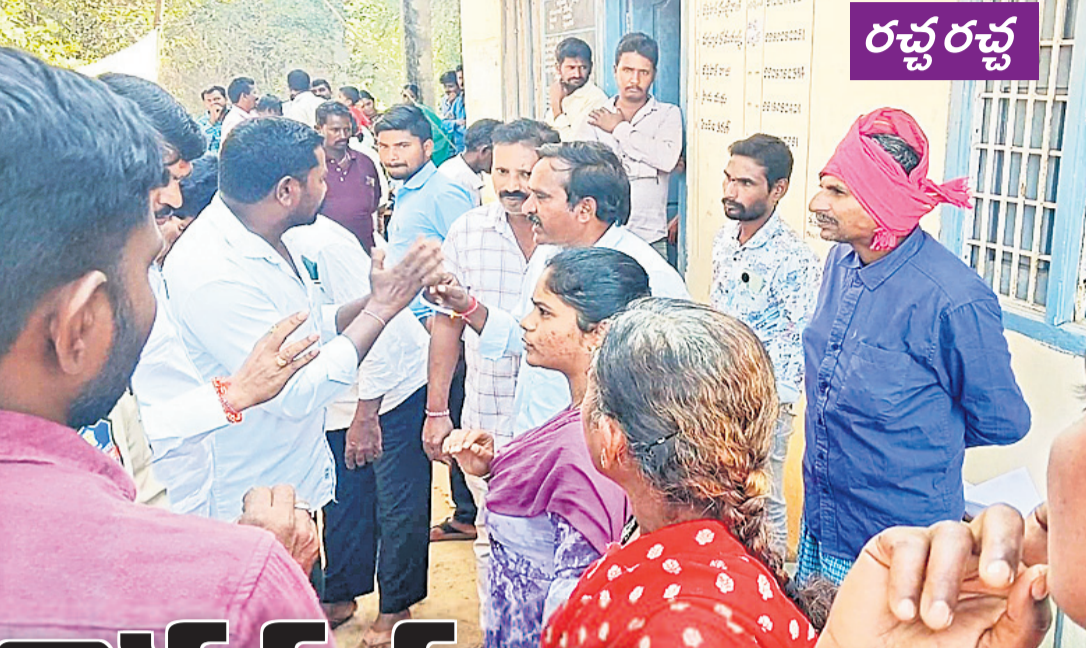
కాయంపేట మండలం నేరడపల్లి గ్రామంలో అసర్వల పేర్లు జాబితాలో ఉన్నాయంటూ అధికారులను నిలదీస్తున్న గ్రామస్థులు

మహబూబాబాద్, జనవరి 21 (నమస్తే తెలంగాణ) : మహబూబాబాద్ ఎమ్మెల్యే మురళీనాయక్ తన సొంత ఊరిలోనే చేదు అనుభవం ఎదురైంది. మంగళవారం మహబూబాబాద్ జిల్లా మహబూబాబాద్ మండలం పర్వతగిరి గ్రామ పరిధిలోని సోమనాథం దాల్ అధికారులు నిర్వహించిన గ్రామసభలో ముఖ్య అతిథిగా ఎమ్మెల్యే పాల్గొన్నారు. అధికారులు లబ్ధిదారుల పేర్లను చదివి వినిపించారు. ఈ సందర్భంగా పలువురు గ్రామస్థులు అధికారులను వారి పేర్లు జాబితాలో చూడకుండా, అర్హతలే తమవి ఎందుకు రాలేదని ఎమ్మెల్యేను నిలదీశారు. రైతు