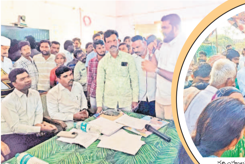
కాటారంలో అధికారులతో వాగ్వాదానికి దిగిన ప్రజలు, నాయకులు