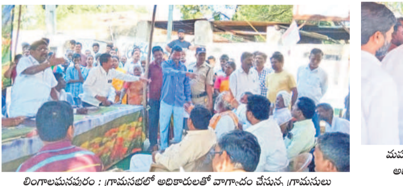
లింగాలపంపూరు : గ్రామసభలో అధికారులతో వాగ్వాదం చేస్తున్న గ్రామస్థులు