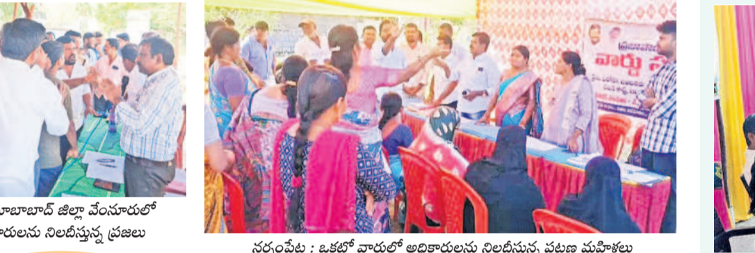
నర్సంపేట : ఒకటి వాడులో అధికారులను నిలదీస్తున్న పట్టణ మహిళలు