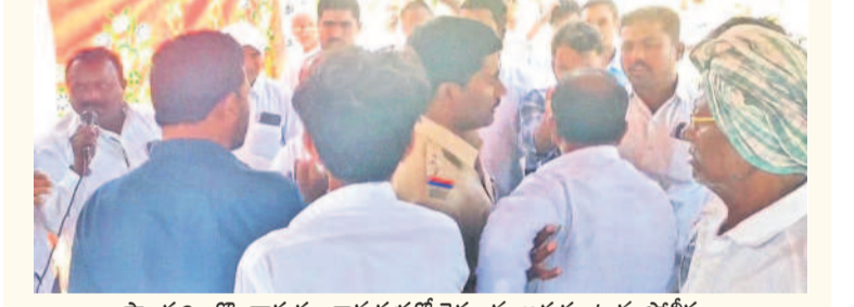
పాలకర్తి : కొండాపురం గ్రామసభలో రైతులను అడ్డుకుంటున్న పోలీసులు