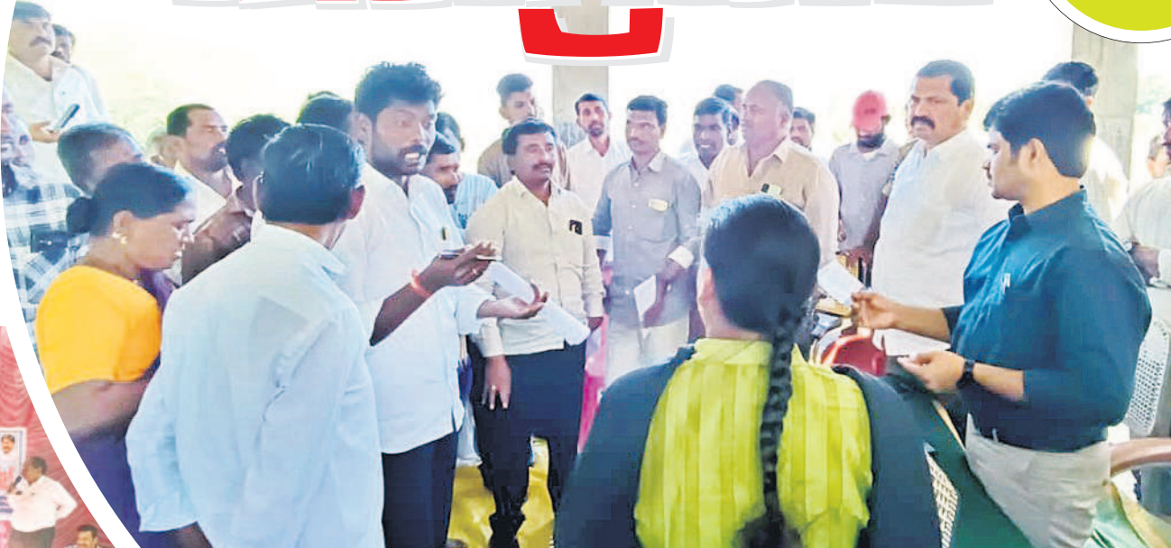
అర్హుల పేర్లు జాబితాలో లేకపోవడంతో బిమ్మండ మండలం పట్టాపూర్ గ్రామసభలో అధికారులను నిలదీస్తున్న గ్రామస్థులు

ప్రభుత్వ పథకాల ఎంపికలో అర్హులైన వారి పేర్లు లేకపోవడంపై జనం మండిపడ్డారు. బోధన మండలం కల్యాణి, పెడగాపల్లి, ఎరాజిపల్లి, మినారీపల్లి, హంగల్, పెంబకుర్తి తదితర గ్రామాల్లో నిర్వహించిన గ్రామసభల్లో జనాగ్రహం వెల్లువెత్తింది. అర్హులైన ప్రతి ఒక్కరికీ రేషన్ కార్డులు, అత్యధిక భార్య, ఇందిరమ్మ ఇంట్లో పథకాలు ఇస్తామని చెప్పారని, ఇప్పుడు లిస్టులో మాన్య అర్హులైన తమ పేర్లు రాలేవని జనం మండిపడ్డారు. కల్యాణిలో రేషన్ కార్డు, ఇందిరమ్మ ఇంట్లో, అత్యధిక భార్య పథకాలలో తమ పేర్లు రాలేదని అధికారులను పలువురు నిలదీశారు. పెడగాపల్లి గ్రామంలో ఉపాధి భూమి పనులు చేసినా, గుంట భూమి లేకున్నా ఇందిరమ్మ అత్యధిక భార్య పథకం కింద