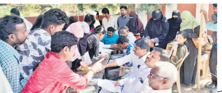
బోధనలో అర్హుల పేర్లు జాబితాలో లేకపోవడంపై అధికారులను నిలదీస్తున్న యువకులు