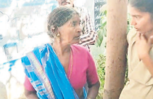
మహిళా రైతు లింగబాయిని సమదాయిస్తున్న పోలీసు

కమ్యూన్టీటీ గ్రామసభల్లో మహిళా రైతు ఆగ్రహం