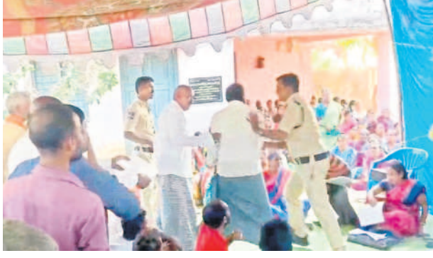
నర్సాపూర్ గ్రామసభలో ప్రశ్నిస్తున్న వ్యక్తిని తోనెస్తున్న పోలీసులు

జనాలపై పోలీసులు కమ్యూన్టీటీ మండలం నర్సాపూర్ గ్రామంలో మంగళవారం జరిగిన గ్రామసభ రచ్చగా సాగింది. రైతుభరోసాకు సంబంధించి అధికారుల తీరుపై ప్రజలు అగ్రహం వ్యక్తం చేశారు. రైతుభరోసాలో పేర్లు ఎలా తొలగించారని నిలదీశారు. ఇప్పటి వరకు పేర్లు తొలగించడం ఏమిటని ప్రశ్నించారు. సభ రచ్చరచ్చగా మారుతుండడంతో పోలీసులు వచ్చి ప్రజలను అక్కడి నుంచి నిష్కేయం కలకలం రేపింది.