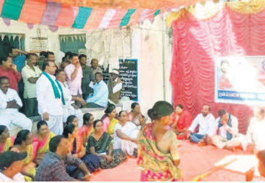
కమ్యూన్టీటీ గ్రామసభల్లో అధికారులపై ప్రజల వద్దం కులదీస్తున్న స్థానికులు