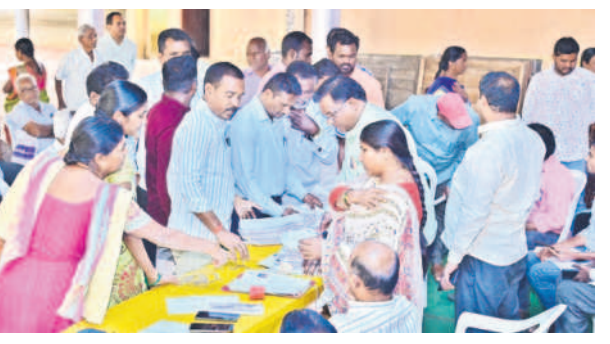
నిజామాబాద్లో దరఖాస్తులు స్వీకరిస్తున్న అధికారులు

నిజామాబాద్, జనవరి 21 (నమస్తే తెలంగాణ ప్రతినిధి) కాంగ్రెస్ ప్రభుత్వం అమలు చేయనున్న నాలుగు పథకాలకు అర్హులను ఎంపిక కోసం తలపెట్టిన గ్రామ, వార్డు సభల మంగళవారం తీవ్ర గందరగోళం చేయడం ప్రారంభమయ్యాయి. ఇందిరమ్మ ఇంట్లో, రైతుభరోసా, కొత్త రేషన్ కార్డులు, ఇందిరమ్మ అత్యధిక భార్య పథకాలకు అర్హులను ఎంపిక కోసం మంగళవారం ఉమ్మడి జిల్లాలో నిర్వహించిన గ్రామ, వార్డు సభలు దుర్భరంగా మారాయి. అయితే పథకాలకు సంబంధించి అర్హుల పేర్లు జాబితాలో లేకపోవడం, కొన్ని పథకాలకు జేత ఇంటి నుంచి ముగ్గురు, నలుగురిని ఎంపిక చేయడం వివాదాస్పదమైంది. అనేక లోటుపాట్లతో కూడిన జాబితాలు ప్రదర్శించడంపై ప్రజలు నిలదీయడంతో గ్రామసభల్లో గందరగోళం నెలకొన్నది. మరోవేపు, పోలీసు పహారా నడుమ సభలు నిర్వహించడం, లోసుగులపై ప్రశ్నిస్తున్న ప్రజలపై వారు జులం ప్రదర్శించడం విమర్శలకు తావిచ్చింది.