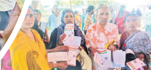
తమ పేర్లు జాబితాలో లేవని పత్రాలు చూపుతున్న అర్హులరులు