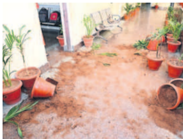
నల్లగొండ మున్సిపల్ ఆఫీస్ లో కాంగ్రెస్ మూకల దాడిలో ధ్వంసమైన పూలకుండీలు

దాడిలో సామ్మన్ లిచ్చామని మాజీ ఎమ్మెల్యే కంచర్ల ప్రేక్షక పాత్ర వహించిన పోలీసులు మాజీ ఎమ్మెల్యే కంచర్లతోపాటు బీఆర్ఎస్ శ్రేణుల అరెస్టు దాడి చేస్తున్నా కాంగ్రెస్ గూండాలను నిలువరించని పోలీసులు నోటీసులు ఇవ్వకుండా బీఆర్ఎస్ మహా ధర్మా ఫైట్స్ లు తొలగించిన మున్సిపల్ అధికారులు పథకం ప్రకారం ఫైట్స్ లు మాటున దాడి చేశారంటున్న గులాబీ నేతలు