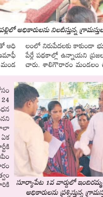
సూర్యాపేట 1వ వార్డులో ఇందిరమ్మ ఇండ్లపై అధికారులను ప్రశ్నిస్తున్న గ్రామస్థులు

నల్లగొండ మండలం కంచర్లపల్లిలో అధికారులను నిలదీస్తున్న గ్రామస్థులు