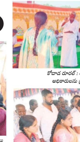
నల్లగొండ మండలం కంచర్లపల్లిలో అధికారులను నిలదీస్తున్న గ్రామస్థులు