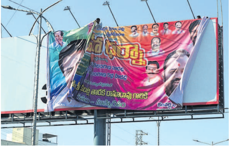
నల్లగొండలో బీఆర్ఎస్ ఏర్పాటు చేసిన రైతు మహా ధర్మా ఫైట్స్ లను తొలగిస్తున్న మున్సిపల్ సిబ్బంది