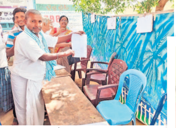
బిన్నగూడూరు : ఖాళీ కుర్చీలకు దరఖాస్తు ఇస్తున్న గ్రామస్థులు