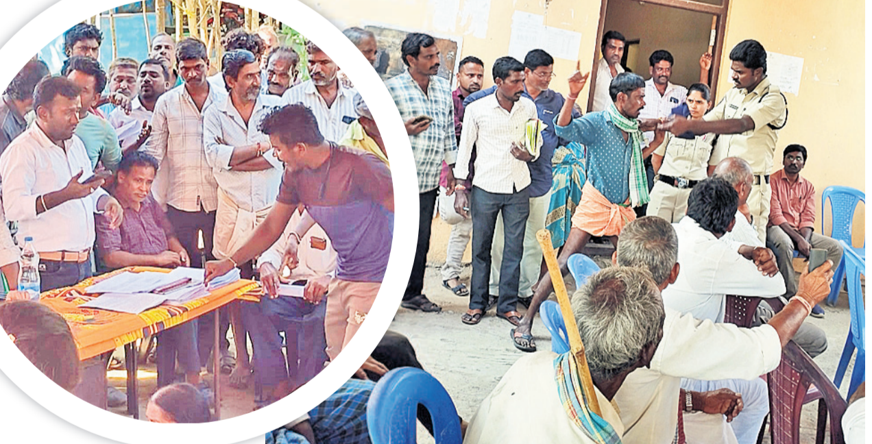
రఘునాథపల్లి : కోడూరులో అధికారులను నిలదీస్తున్న యువకుడు