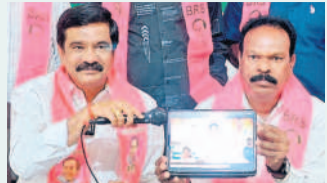
కాంగ్రెస్ ఎమ్మెల్యేలు మాట్లాడిన వీడియోను చూపిస్తున్న వేముల