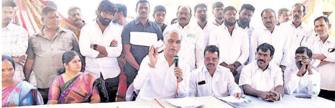
గాడిచర్లపల్లి గ్రామసభలో రుణమాఫీ కాలేదని రైతులు ఇచ్చిన దరఖాస్తులను, బ్యాంకులో మితి కట్టిన కౌంటర్ ఫైల్స్ చూపుతున్న హాజరైతారు

ముఖ్యమంత్రి హైదరాబాద్లో ఉండటం కాదు, ఊర్లో గ్రామసభలు రావాలి, పోలీస్ పహారాల మధ్య, నిర్బంధాల మధ్య గ్రామసభలు నిర్వహిస్తున్నారు. మాట్లాడితే అరెస్టు చేస్తారు.. -హాజరైతారు