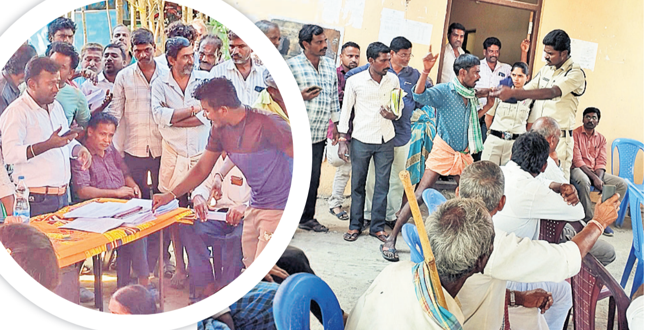
రఘునాథపల్లి : కోడూరులో అధికారులను నిలదీస్తున్న యువకుడు