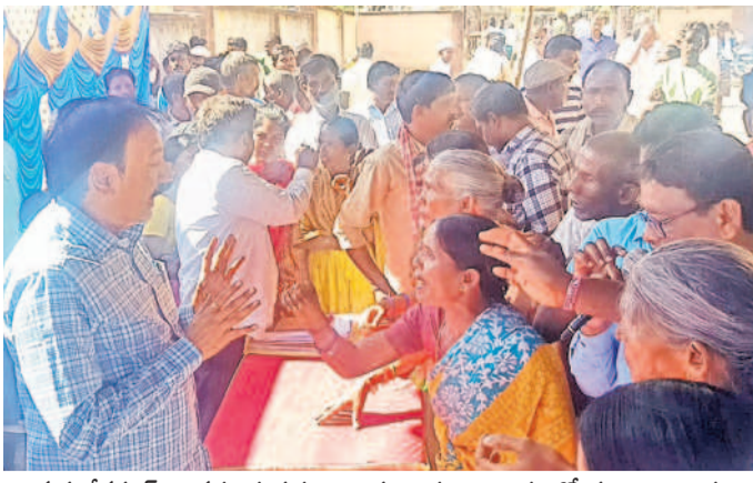
మహావేదవార్: అనర్థాలకు పథకాలు ఇస్తున్నారని అధికారులతో ప్రజల వాగ్వాదం