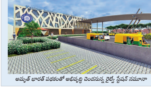
అమ్మకే భారత్ పథకంతో అభివృద్ధి చెందనున్న రైల్వే స్టేషన్ సమాచారం

గంగా కొనసాగుతున్నట్లు అధికారులు తెలిపారు. కాగా, ఏపీఎస్ఎస్ కింద తెలంగాణలో మొత్తం 40 స్టేషన్లు ఎంపికైనట్లు పేర్కొన్నారు. కాజీపేట రైల్వే స్టేషన్ ను 1888లో నిజాం గ్యారంటీడ్ స్టేట్ రైల్వే నిర్మాణం చేపట్టింది. ఈ స్టేషన్ సికింద్రాబాద్-డిల్లీ రైలు మార్గంలో నిర్మించబడింది. కాజీపేట రైల్వే స్టేషన్ ప్రాంతంలో బోగొట్ట, పత్తి, గ్రానైట్, సిమెంట్ తదితర పనులు అందుబాటులో ఉండడంతో ప్రస్తుతం రవాణాలో కీలక పాత్ర పోషిస్తున్నది. కాజీపేట రైల్వే స్టేషన్ నుంచి రాయి గు రైల్వే ప్రారంభం అవుతుండడంతో పాటు ప్రతి రోజు దాదాపు పంద ప్రయాణికుల రైల్వే కాజీపేట - బార్షా, కాజీపేట-విజయవాడ, కాజీపేట - సికింద్రాబాద్ నకల్ నోల్ రాకపోకలు సాగిస్తాయి. ఇప్పటికే 40 శాతం పనులు పూర్తయినట్లు అధికారులు చెబుతున్నారు.