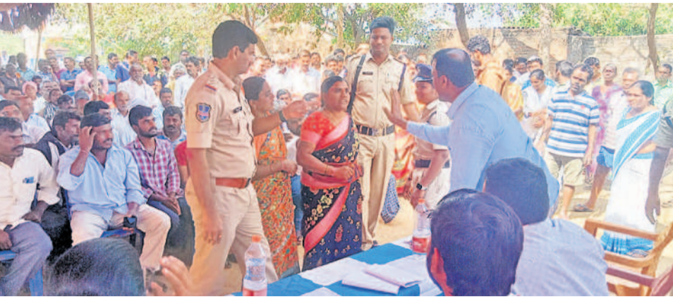
నర్సంపేట : ఇటుకలపల్లి గ్రామ సభలో పథకాలపై నిలదీస్తున్న మహిళలను సముదాయిస్తున్న అధికారి