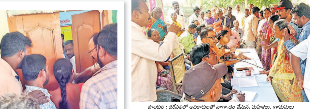
రాయపల్లి : కొలనుపల్లిలో అధికారులను నిలదీస్తున్న దుర్గయ్యను బయటకు నెట్టివేస్తున్న కానిస్టేబుల్