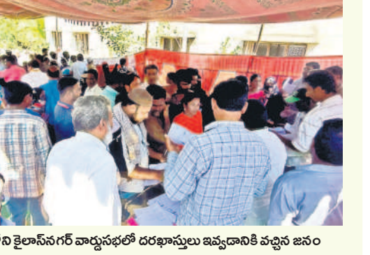
పట్టణంలోని కైలాసంగనగర్ వార్డు సభలో దరఖాస్తులు ఇవ్వడానికి వచ్చిన జనం

టున్న వారికి ఎలాంటి రసీదులు ఇవ్వకపోవడం లేదు. దీంతో తాము దరఖాస్తు ఇచ్చినట్లు నిరూపించుకోవడానికి ఆశ్చర్యం వ్యక్తం చేస్తున్నారు. ప్రజాపాలనలో దరఖాస్తు ఇచ్చే రసీదులు జబ్బినా రేషన్ కార్డులు, ఇందిరమ్మ ఇండ్లు రాలేదని, ఇప్పుడు సన్ధ్యాయని సమస్యం లేదని అసంతృప్తి వ్యక్తం చేస్తున్నారు. బుధవారం పట్టణంలోని 35 వార్డు సభకు హాజరైన స్థానిక ఎమ్మెల్యే పావన్ శంకర్ దరఖాస్తుదారులకు రసీదులు ఎందుకు ఇవ్వడం లేదని, కల్తెకార్డు తో విషయం మూల్యాంకనం అన్నారని అన్నారు. అభిదారుల ఎంపికలో సందిగ్ధత అభిదారుల ఎంపికలో భాగంగా అర్జుల జాబితాను వార్డు, గ్రామసభల్లో ప్రదర్శించు న్నారు. ఏమైనా అభ్యంతరాలు ఉంటే తెలియజేయాలని అధికారులు కోరుతున్నారు. జనం జాబితాలో తమ పేర్లు లేకపోవడంతో ఆందోళన చెందుతున్నారు. అసలు విషయం పట్టణంకోసం లేదు. దీంతో ఎక్కువ అభ్యంతరాలు వ్యక్తం కావడం లేదు. రేషన్ కార్డుల జాబితాలో అర్జుల, అసర్దులను ప్రకటించగా, ఇందిరమ్మ ఇండ్ల జాబితాలో అర్జుల పేర్లు మాత్రమే ఉన్నాయి. వారిలో ఎవరికి ఇండ్లు వస్తాయనే సస్యత లేదు. సొంత జాగా ఉన్నా పక్కా ఇండ్లు లేని వారి జాబితాలో పాటు అర్జుల ఉంటున్న వారి వివరాలు మాత్రమే ఉంటున్నాయి. ఈ జాబితాను చూసుకుంటున్న జనం తమకు ఇళ్లు మంజూరించడం అనుకుంటున్నారు. ఇండ్ల మంజూరు విషయంలో అధికారులను అడిగితే ప్రభుత్వం ఆయన నియామకంకొరకు మంజూరు చేసి ఇండ్లకు అనుగుణంగా అర్జులకు ఇండ్లు మంజూరుచేయాలని అంటున్నారు.