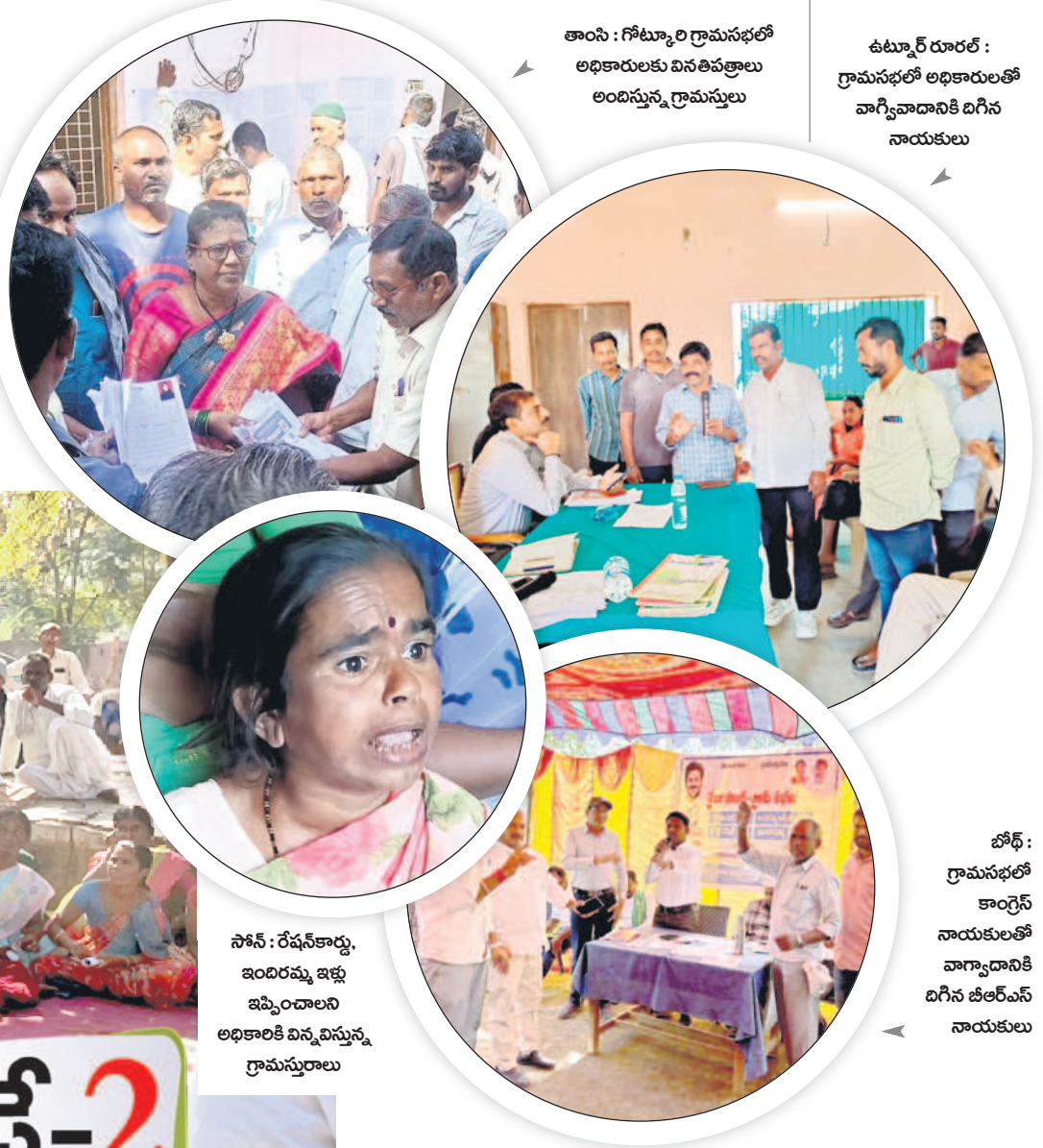
తాంసి : గోటూర్ గ్రామసభలో అధికారులకు వివరాలు తెలియజేయడానికి అధికారులు ఉమ్మడి రూరల్ : గ్రామసభలో అధికారులతో వాగ్వివాదానికి దిగిన నాయకులు