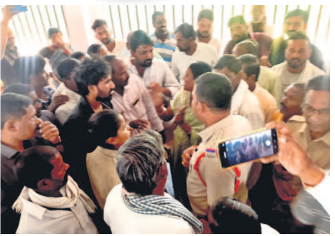
తలమడుగు : సుంకిడిలో అధికారులతో వాగ్వివాదానికి దిగిన బీఆర్ఎస్ నాయకులు