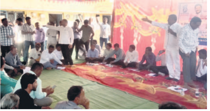
ఇంద్రవెల్లి : వాగ్వివాదానికి దిగిన కాంగ్రెస్ పార్టీ, బీఆర్ఎస్ పార్టీ నాయకులు