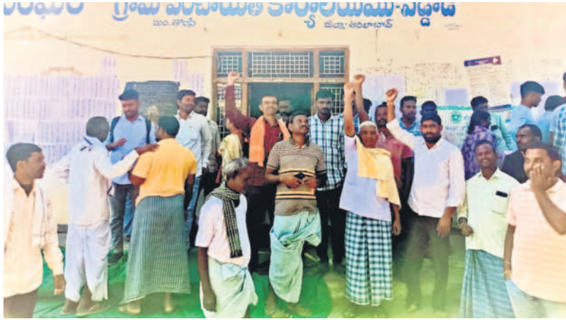
తాంసి : గ్రామసభను బహిష్కరించి నిరసన తెలుపుతున్న వడ్డెడి గ్రామస్థులు

ప్రభుత్వ పథకాలకు అభిదారుల ఎంపిక కోసం నిర్వహిస్తున్న గ్రామసభలు రెండో రోజైన బుధవారం యుద్ధ భూములను తలపించాయి. అభిదారుల ఎంపికలో లోటుపాట్లు ఉన్నాయంటూ.. అర్జుల పేర్లు జాబితాలో లేవంటూ జనం తిరగబడ్డారు. అర్జుల పేర్లు లేకుండా అధికార పార్టీ చెప్పినట్లు ప్రజాపాలన నిర్ణయం చేశారా? అంటూ ప్రశ్నించారు. ఉమ్మడి ఆదిలాబాద్ జిల్లా వ్యాప్తంగా పలు గ్రామ, వార్డు సభల్లో రెండో రోజైన బుధవారం నిరసనలు, నిలదీతలు, ఆందోళనలు కొనసాగాయి.