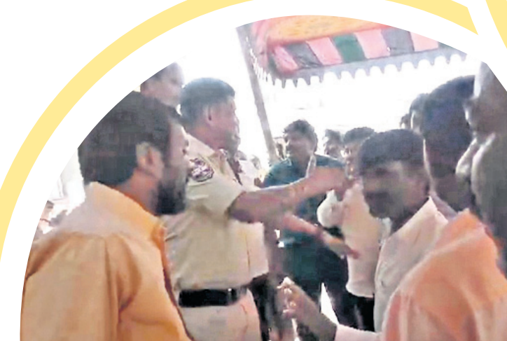
యాదాద్రి మండలం ధర్మగుడ గ్రామసభలో అందోళన వ్యక్తం చేస్తున్న గ్రామస్థులు

లును అందించేలా వ్యవహరిస్తున్నది. కమిటీల ఏర్పాటు మొదలుకొని అర్హిదారుల ఎంపిక వరకు అంతా కాంగ్రెస్ పార్టీకి అనుకూలంగా ఉన్నవారికి ప్రయోజనం చేశారేలా ముందుకెళ్ళడంపై ప్రజలు అసంతృప్తి వ్యక్తం చేస్తున్నారు. ఇండ్లు ఉన్నవారికి ఇండ్లు ఇస్తారా అంటూ అధికారులను నిలదీస్తున్నారు. బుద్ధవారం కోట్పల్లి మండలంలోని కరీంపూర్ గ్రామంలో ఇండ్ల అర్హిదారుల ఎంపిక సరిగ్గా జరగలేదని అధికారులను నిలదీశారు. నియోజకవర్గానికి 3500 ఇండ్లను ప్రభుత్వం మంజూరు చేయగా, ప్రజాపాలనతో పాటు గతంలో స్వీకరించిన వాటిలో 2.50 లక్షల దరఖాస్తులందగా, వీటిలో 1.70 లక్షల దరఖాస్తు దారులను అర్హులుగా తేల్చారు. మంగళవారం ఒక్కరోజు జిల్లాలో ఇందిరమ్మ ఇండ్ల పథకానికి గాను 3500 దరఖాస్తులు రావడం గమనార్హం.