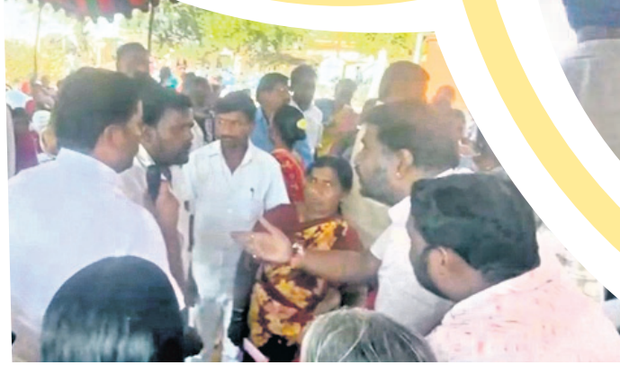
పెద్దేములపేట మున్సిపాలిటీ పరిధిలోని గొర్రెల్లో అధికారులను నిలదీస్తున్న గ్రామస్థులు