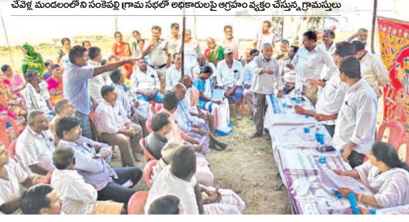
చేపేళ్ల మండలంలోని సంకెప్ప గ్రామసభలో అధికారులపై ఆగ్రహం వ్యక్తం చేస్తున్న గ్రామస్థులు