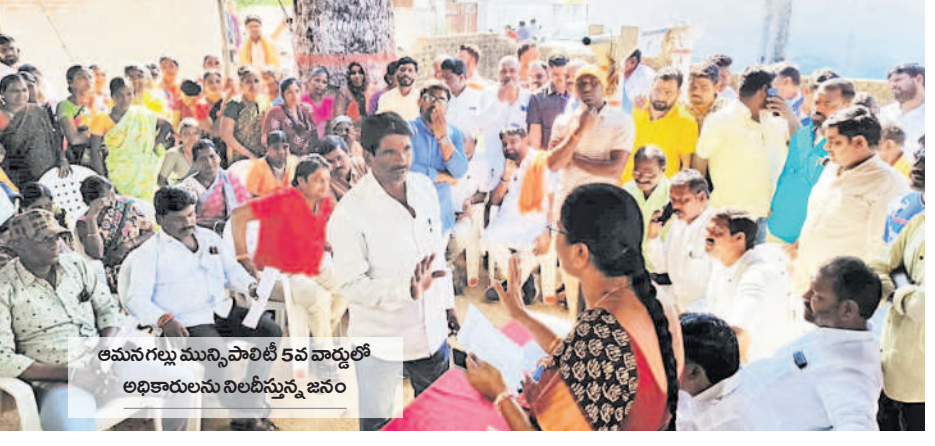
అమనగల్లు మున్సిపాలిటీ 5వ వార్డులో అధికారులను నిలదీస్తున్న జనం

సమస్యలపై ప్రశ్నించే వారిని అక్కడి నుంచి బలవంతంగా పంపించేశారు. గ్రామసభల్లో పోలీసుల జోక్యంపై పలువురు అభ్యంతరం వ్యక్తం చేశారు. జిల్లావ్యాప్తంగా జరిగిన గ్రామసభల్లో ఎక్కడ చూసినా పోలీసులు అత్యుత్సాహాన్ని ప్రదర్శించారు.