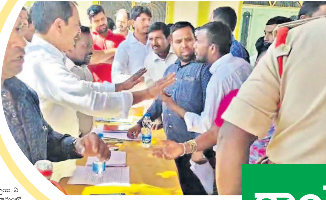
బంటూరం మండలంలోని కరీంపూర్ గ్రామ సభలో అధికారులను నిలదీస్తున్న గ్రామస్థులు

I హైదరాబాద్, గురువారం 23 జనవరి 2025 RANGAREDDY