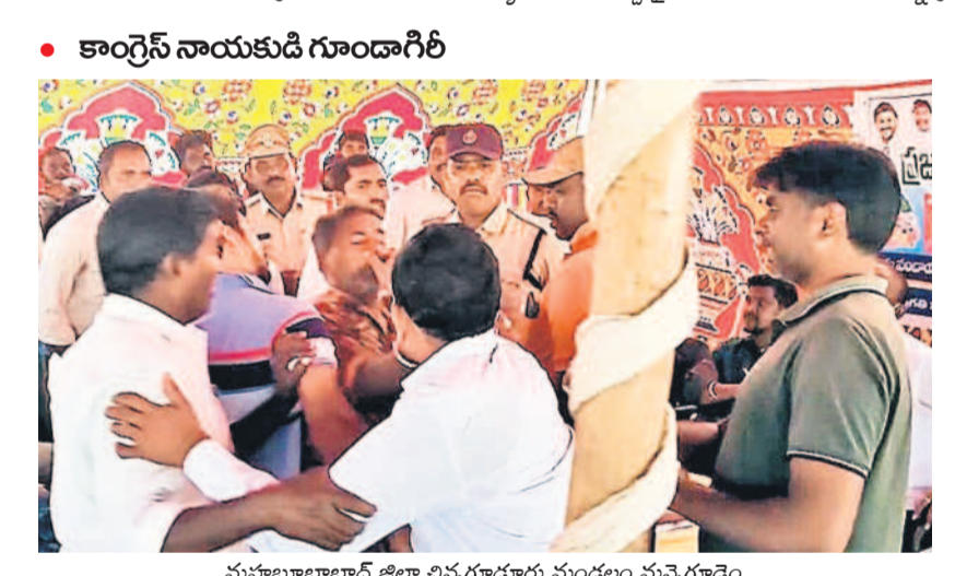
• కాంగ్రెస్ నాయకుడి గూండాగిరి