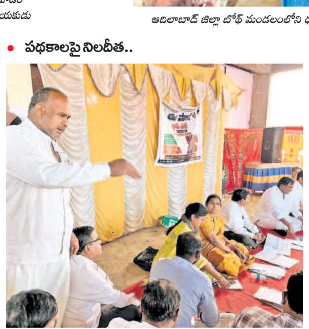
• పథకాలపై నిలబీత..