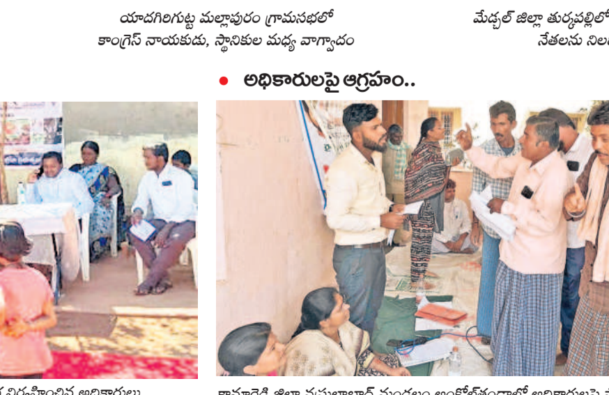
• అధికారులపై ఆగ్రహం..