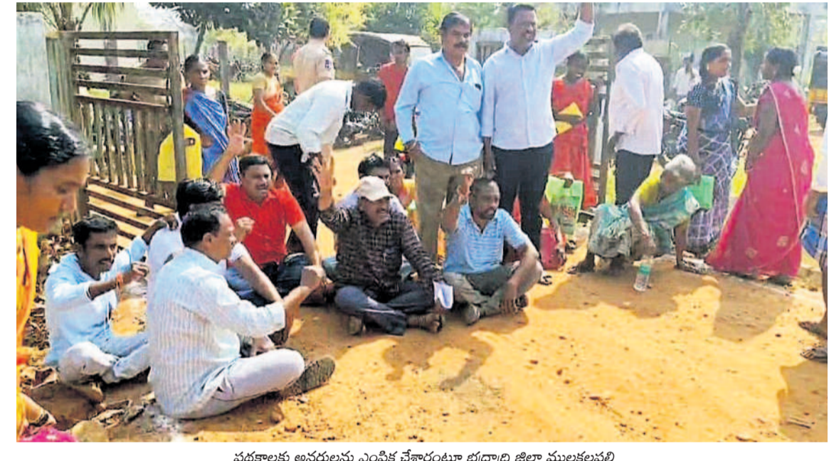
• పంచాయతీ కార్యాలయం ముందు ధర్నా..