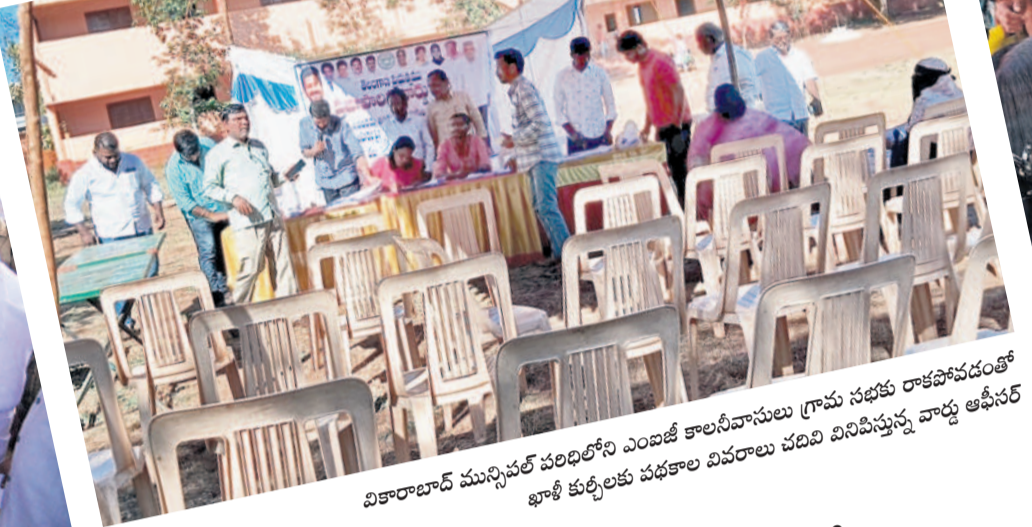
• ఖాళీ కుర్చీలతో గ్రామసభ