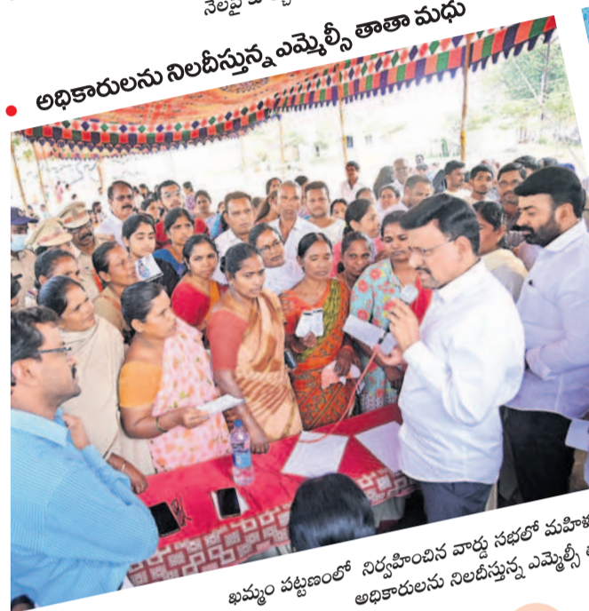
• అధికారులను నిలబెట్టే ఎమ్మెల్యే తాతా మధు

గ్రామసభలు నిర్వహించిన మూడో రోజు గురువారం కూడా ప్రజలు ఎక్కడిక్కడ అధికారులను, కాంగ్రెస్ నాయకులను నిలబేశారు. రేషన్ కార్డులు, ఇందిరమ్మ ఇండ్లు, రైతు భరోసా తదితర పథకాల గురించి ప్రశ్నించారు. అద్దలకే పథకాలు వర్తించడంకోసం కోరారు. కొన్ని చోట్ల జాబితాలో పేర్లు లేకపోవడంతో ఆడబిడ్డలు కంటితడి పెట్టారు. కొన్ని చోట్ల స్థానికులపై అధికార కాంగ్రెస్ నాయకులు చెయ్యి చేసుకున్నారు. మొత్తానికి మూడు రోజులుగా గ్రామసభలు, వార్డు సెషన్లలో ప్రజల అసంతృప్తి అడుగుడుగునా కనిపించింది.