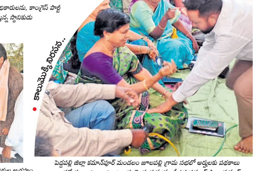
• కాలమ్మెక్కి నిరసన..