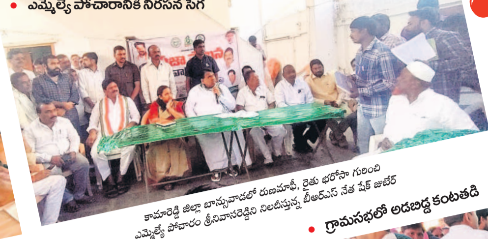
• ఎమ్మెల్యే పోచారానికి నిరసన సెగ

గ్రామసభలు నిర్వహించిన మూడో రోజు గురువారం కూడా ప్రజలు ఎక్కడిక్కడ అధికారులను, కాంగ్రెస్ నాయకులను నిలబేశారు. రేషన్ కార్డులు, ఇందిరమ్మ ఇండ్లు, రైతు భరోసా తదితర పథకాల గురించి ప్రశ్నించారు. అద్దలకే పథకాలు వర్తించడంకోసం కోరారు. కొన్ని చోట్ల జాబితాలో పేర్లు లేకపోవడంతో ఆడబిడ్డలు కంటితడి పెట్టారు. కొన్ని చోట్ల స్థానికులపై అధికార కాంగ్రెస్ నాయకులు చెయ్యి చేసుకున్నారు. మొత్తానికి మూడు రోజులుగా గ్రామసభలు, వార్డు సెషన్లలో ప్రజల అసంతృప్తి అడుగుడుగునా కనిపించింది.