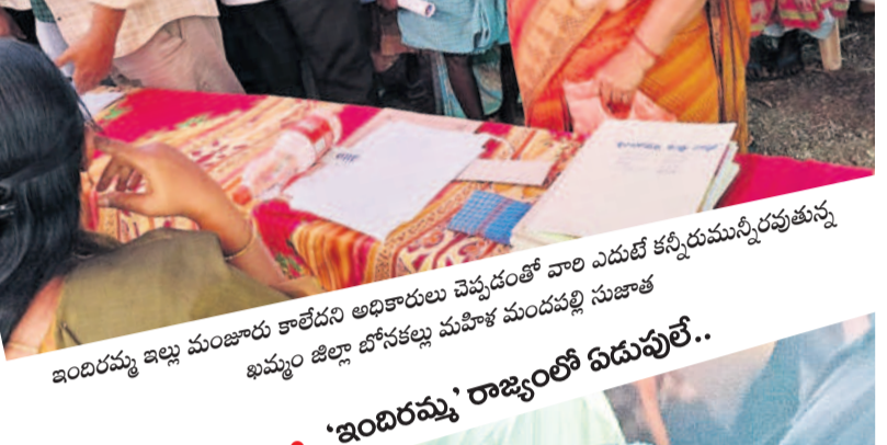
• గ్రామసభలో అదబద్ధ కంటితడి