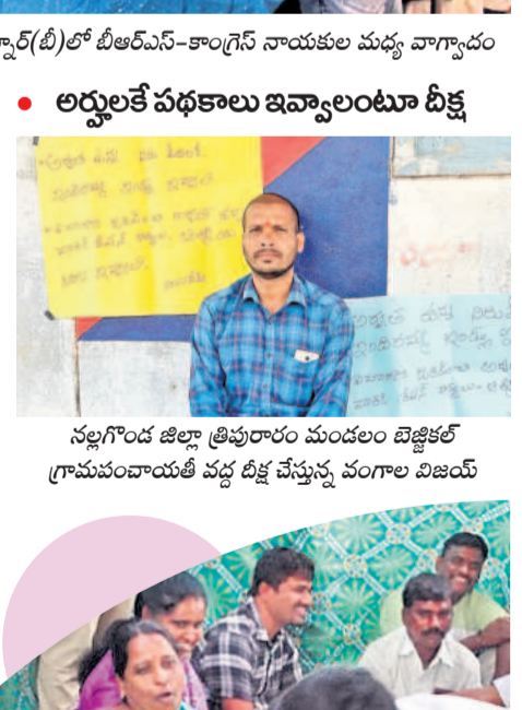
• అద్దలకే పథకాలు ఇవ్వాలంటూ దీక్ష