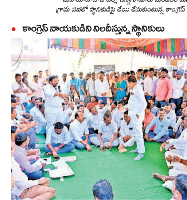
• కాంగ్రెస్ నాయకుడిని నిలబెట్టే స్థానికులు