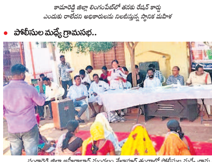
• పోలీసుల మధ్యే గ్రామసభ..