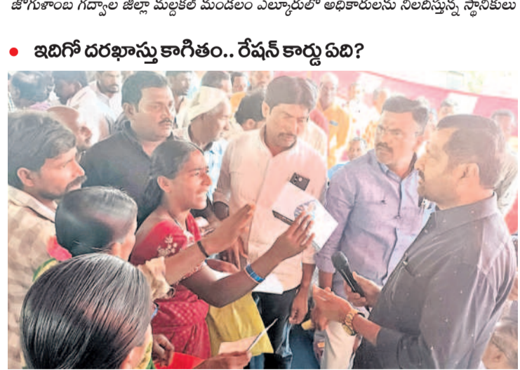
• ఇదిగో దరఖాస్తు కాగితం.. రేషన్ కార్డు ఏది?