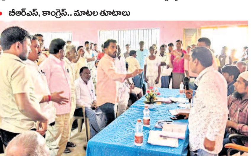
• టీఆర్ఎస్, కాంగ్రెస్.. మాటల తూటాలు