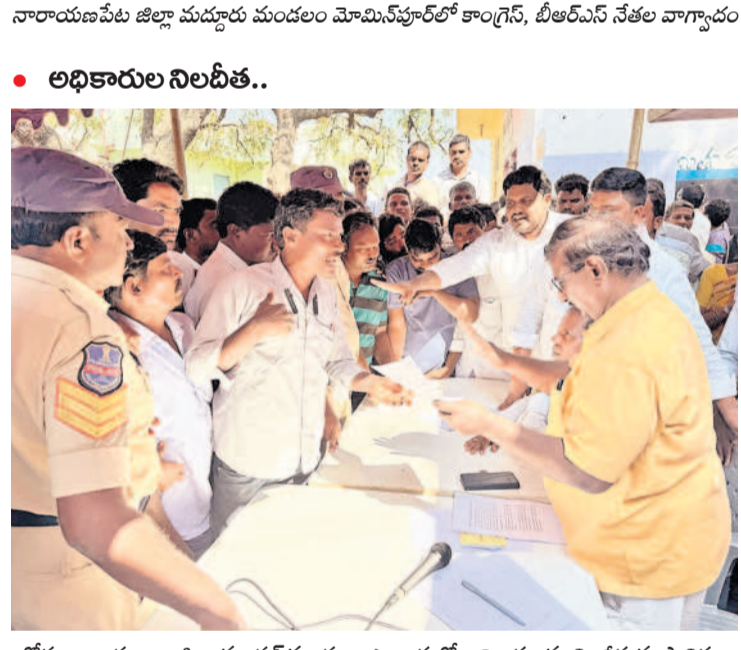
• అధికారుల నిలబీత..