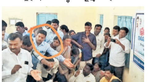
బేత్కల్ మండల కేంద్రంలో నిర్వహించిన గ్రామసభలో ప్రజలను బెదిరిస్తున్న కాంగ్రెస్ కార్యకర్త