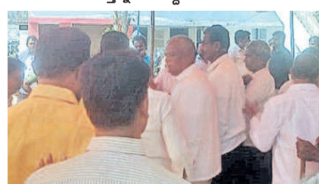
తూప్రాన్: ఇన్చార్జిలో నిర్వహించిన గ్రామసభలో లభికారులతో వాగ్దానానికి దిగుతున్న గ్రామస్థులు