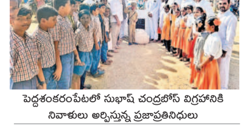
పెద్దశంకరంపేటలో సుభాష్ చంద్రబోస్ విగ్రహానికి నివాళులు అర్పిస్తున్న ప్రజాప్రతినిధులు