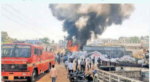
మంటలను అదుపు చేస్తున్న ఫైర్ సిబ్బంది