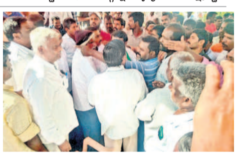
వెల్లిపల్లి: మాసాయిపేట మండలంలో పరస్పరం ఆరోహణలు చేసుకుంటూ వాగ్దానానికి దిగిన ఆయా పార్టీల నాయకులు