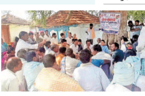
కొల్లూరం: మందాపూర్ గ్రామసభలో ఇందిరమ్మ భరోసా పథకంపై లభికారులను ప్రశ్నిస్తున్న ఓ వ్యక్తి