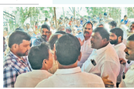
శివ్వంపేట: గోమారంలో నిర్వహించిన గ్రామసభలో వాగ్దానం చేసుకుంటున్న ఆయా పార్టీల నాయకులు