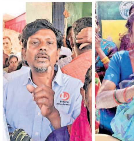
చేగుంట, వెల్లిపల్లిలో పథకాల్లో తమ పేర్లెక్కడ ఉన్నాయని ప్రశ్నిస్తున్న ప్రజలు

కౌడిపల్లి, జనవరి 23: మోసపూరితమైన మాటలు పక్కకు పెట్టి ప్రజల సమక్షంలోనే నిర్ణయం తీసుకుని అర్హులకు న్యాయం చేయాలని నర్సాపూర్ ఎమ్మెల్యే సునీతారాకాంత్ అన్నారు. గురువారం మండలంలోని నాగ్వాన్ పల్లిలో గ్రామసభ నిర్వహించారు.