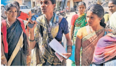
చేగుంట మండలకేంద్రంలో ఏర్పాటు చేసిన గ్రామసభలో తమ పేర్లు రాలేదని ఆందోళన చేస్తున్న మహిళ