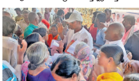
బిలిచెడ: చందూర్లో వృద్ధులు పింఛన్ ఇష్యుచేసే సారీ అంటూ గ్రామ కార్యదర్శి జి.ఎం.ఎ. కిరీతున్న వృద్ధులు