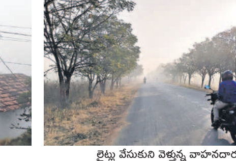
లైట్లు వేసుకుని వెళ్తున్న వాహనదారులు