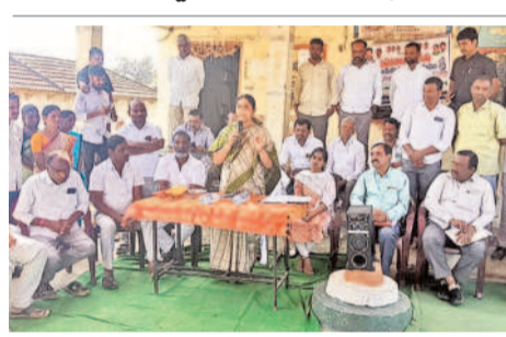
కౌడిపల్లి: నాగ్వాన్ పల్లి ప్రజాపాలన గ్రామసభలో మాట్లాడుతున్న నర్సాపూర్ ఎమ్మెల్యే సునీతారాకాంత్