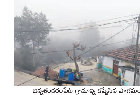
చిన్నశంకరంపేట గ్రామాన్ని కమ్మేసిన పొగమంచు

వస్తున్న వాహనాలు కనబడలేదు. ఉడయం గంటలకు కూడా పొగమంచు కమ్మేడయం తో వాహనదారులు లైట్లు వేసుకొని వెళ్ళాల్సిన పరిస్థితి ఏర్పడింది.