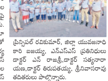
ట్రాఫిక్ నిబంధనలపై వాహన దారులకు అవగాహన