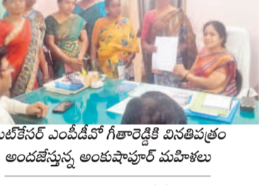
ఘట్టేసర్ ఎంపీడీవో గౌతాంబా విస్తీర్ణం అందజేస్తున్న అంకపాపూర్ మహిళలు

ఘట్టేసర్, జనవరి 24: భూమి లేని వ్యవసాయ కూలీలందరికీ ఇందిరమ్మ అత్తీయ భరోసా ఇవ్వాలని అంకపాపూర్ మహిళలు శుక్రవారం ఎంపీడీవో గౌతాంబా విస్తీర్ణం అందజేశారు. అనంతరం స్థానిక గాండ్ పీఠం వద్ద ఆందోళన నిర్వహించారు. ప్రభుత్వం అత్తీయ భరోసా పథకం కింద సంవత్సరానికి రూ.12 వేలు ఇస్తామని డిమాండ్ చేసిన వారిని నెలవేతనాలని డిమాండ్ చేశారు. ప్రభుత్వం మాట మార్చి 2023-24 సంవత్సరంలో కనీసం 20 రోజుల ఉపాధి హామీ పని చేసినవారికి మాత్రమే ఇస్తామని పరతులు పెడుతున్నదని ఆరోపించారు.