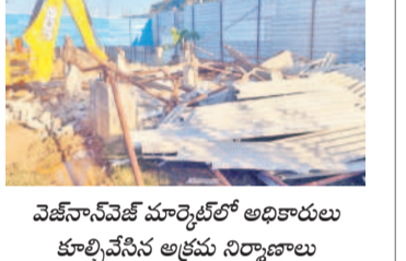
వెజ్ నాన్ వైట్ మార్కెట్లో అధికారులు కూల్చివేసిన అక్రమ నిర్మాణాలు

జవహర్ నగర్, జనవరి 24: బీఆర్ఎస్ ప్రభుత్వం ప్రజా ఆవసరాల కోసం వెజ్ నాన్ వైట్ మార్కెట్ ను కేటాయించగా... కోట్ల విలువైన రేకులు అక్రమ నిర్మాణాలకు కన్ను మూసింది. ఆయనను సీట్లు రేకులు అడ్డంపెట్టి... అక్రమంగా నిర్మాణాలు చేపట్టారు. కాఫీ తహా సీల్డార్ సుచరిత సకాలంలో స్పందించి అక్రమ నిర్మాణాలను కూల్చివేయించారు.