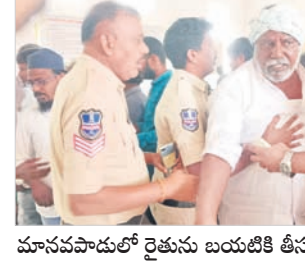
మానవపాడులో రైతును బయటికి తీసుకెళ్లిన పోలీసులు

గ్రామసభ రసాభాస.. వనపర్తి మండలంలోని పెద్దగూడెంలో జరిగిన గ్రామసభ రసాభాస అయింది. గ్రామకూడలిలోని అంజనేయస్వామి గుడి వరండాలో గ్రామసభ ఏర్పాటు చేయగా, జనం పెద్దపెత్తున కరలి పచ్చారు. అధికారులు గ్రామంలో ఇండ్ల జాబితాలో వచ్చిన వారి పేర్లు చదువుతుండగానే ఒక్కసారిగా అధికారులపైకి తిరగబడ్డారు. లిస్టులో తమ పేర్లు ఎందుకూ రాలేదని, ఎందుకూ ఈ సభలు పెట్టారని, నిరుపేదలకు ఇస్తామని కేవలం ఒకపార్టీకి చెందిన వారి పేర్లు చదవడం వల్ల గందరగోళం చెలరేగింది. ఎలాంటి భూమి లేని నిరుపేదలకు ప్రభుత్వం నుంచి లబ్ధిచేకారడం లేదని గ్రామానికి చెందిన మహిళా అధికారులను నిలదీసింది. పట్టుమని పది నిమిషాలు కూడా సభ ముందుకు సాగలేదు. జనం లేవనెత్తిన సమస్యలతో అక్కడికి వచ్చిన అధికారులు సమాధానాలు చెప్పలేక వెనుదిరిగారు.