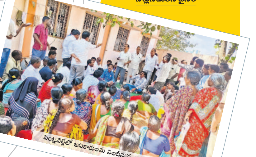
పెండ్లపెట్టిలో అధికారులను నిలదీస్తున్న గ్రామస్థులు

లిస్టును గ్రామసభల్లో ఉంచి వాటికి ఆమోద గాణ ప్రతినిధి : ఆండోళ్లు నిరసనలు నిల దీశారు. బహుశురణ మధ్య ఉమ్మడి మానవపాడు జిల్లాలో నిర్వహించిన గ్రామసభ గం గంగా నాలుగు పథకాలను సమర్పించడంగా అమలు చేయాలని భావించి ఏర్పాటు చేసిన గ్రామసభలన్నీ రణరంగాన్ని తలపించాయి. మంత్రిలు ఎమ్మెల్యేలకు కూడా ప్రజలు చుక్కలు చూపించారు. ఇక అధికారులు అయితే సమాధానం చెప్పకోలే పోలీసుల సహకారంతో బయటపడ్డారు. శుక్రవారం నాలుగో రోజు కూడా ఉమ్మడి మానవపాడు జిల్లాలో గ్రామసభలలో పాల్గొని గ్రామస్థులు, నిలదీశారు, నిరసనలతో ముగి