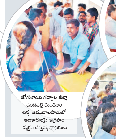
జోగంపాటి గద్దాల జిల్లా ఉండవెల్లి మండలం చిన్న అమ్మల అపాడులో అధికారులపై ఆగ్రహం వ్యక్తం చేస్తున్న స్థానికులు

మానవపాడులో రైతును బయటికి తీసుకెళ్లిన పోలీసులు