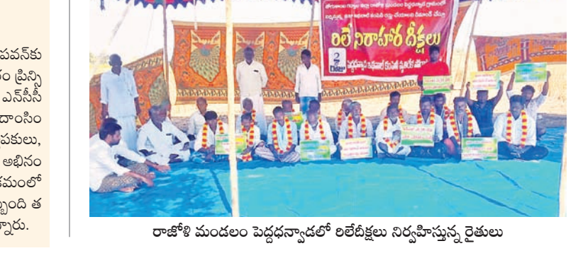
రాజోజి మండలం పెద్దధన్యాడలో లబ్ధిదారుల నిర్వహిస్తున్న రైతులు

రాజోజి, జనవరి 24 : రాజోజి మండలంలోని పెద్ద ధన్యాడలో ఇథనాల్ ఫ్యాక్టరీ అనుమతులు రద్దు చేయాలంటూ గ్రామస్థులు చేపట్టిన నిరాచరణకు శుక్రవారం రెండో రోజుకు చేరుకుంది. వీరి డిమాండ్ ముఖ్యంగా ఉన్న 11 గ్రామాలకు చెందిన రైతులు మద్దతు తెలుపుతూ డిక్లారేషన్లు చేశారు. ఈ సందర్భంగా పలు ఘటనలు ముఖ్యంగా పెద్ద ధన్యాడలో ఇథనాల్ ఫ్యాక్టరీ ఏర్పాటు చేస్తే మండలంలోని వివిధ గ్రామాల్లోని పంట భూముల నష్టం వల్ల యే ఆవేదన వ్యక్తం చేశారు. అంతేకాకుండా పరిశ్రమను రద్దు చేస్తే వ్యర్థాల ద్వారా తుంగభద్ర నది తీరాలకు పరిసర గ్రామాలకు తాగునీరు కూడా కలు