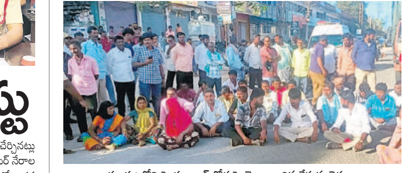
కల్యక్తులలోని హైదరాబాద్ రోడ్డుపై బైకాయించిన చేస్తున్న రైతులు