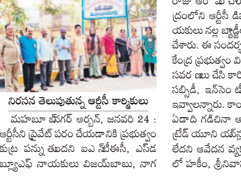
నిరసన తెలుపుతున్న ఆర్టీసీ కార్మికులు