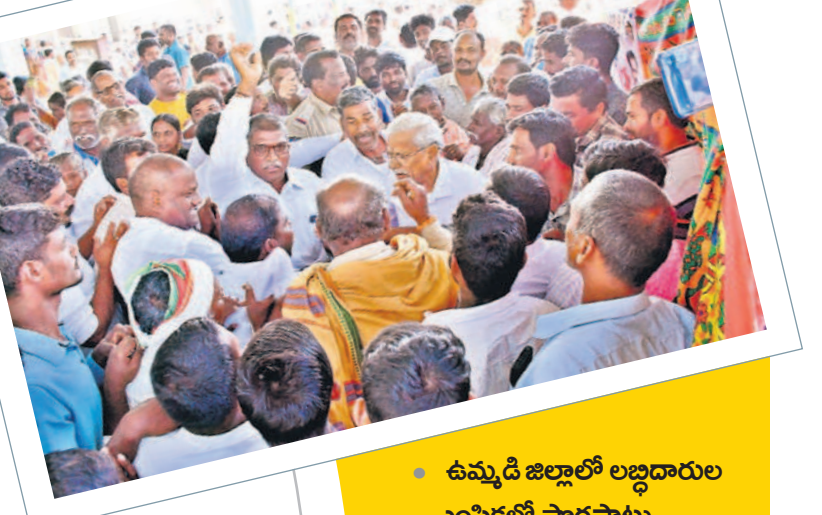
వనపర్తి జిల్లా పెద్దగూడెం గ్రామసభలో రసాభాస

నా యే గ్రామస్థులు ఆగ్రహం వ్యక్తం చేస్తూ భారత్ స్వలాలు మూలంగా జాబితాలో పేర్లు లేక పోవడం ఏమిటి అని అధికారులను ప్రశ్నించారు. రేపటి కంటే జాబితాలో కూడా అన్యాయం జరిగిందని వాపోయారు. ఉండవెల్లి మండలం చిన్న అమ్మల అపాడు గ్రామంలో గ్రామసభ రసాభాస సాగింది. అయితే మండలం ఉప్పుల జిల్లా ఇండ్ల జాబితాలో గ్రామస్థులు ఒక్కసారిగా అధికారులపైకి దండెత్తారు. లిస్టులో కొందరు పేర్లు వచ్చాయని మిగతావారి పేర్లు ఎందుకూ రాలేదని ప్రశ్నల వర్షం కురిపించారు. అయితే కేవలం 10 నిమిషాలు కూడా గ్రామసభ జరిగే గానూ వచ్చిన అధికారులంతా చలా యటం చిక్క గావారు. నారాయణపేట జిల్లా ఉత్పాదక మండలం చిన్నపాడ గ్రామసభలో ప్రజలు అధికారులను నిలదీశారు. జోగంపాటి గద్దాల జిల్లా అలం పూరినియోజకవర్గంలోని మానవపాడు మండలం కేంద్రంలో నిర్వహించిన గ్రామసభ గందరగోళానికి దారితీసింది. ఇందిరమ్మ ఇండ్ల జాబితాలో అవకతవకలు జరిగి