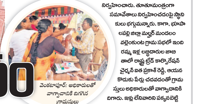
వెంకటాపూర్: అధికారులతో వాగ్యాధానికీ దిగిన గ్రామస్థులు

రేషన్ కార్డు, ఇందిరమ్మ అత్యున్న భరోసా, రైతు భరోసా, ఇందిరమ్మ ఇండ్ల అల్పదారుల ఎంపిక కోసం నిర్వహిస్తున్న గ్రామసభల్లో జనం తిరగబడ్డారు. ఉమ్మడి వరంగల్ జిల్లా వ్యాప్తంగా చివరి రోజు శుక్రవారం నిరసనలు, నిలదీతలతో కొనసాగాయి. ప్రభుత్వ పథకాలు అసర్దులతో వచ్చాయని ప్రజలు ఆగ్రహం వ్యక్తం చేశారు. అర్హులైనా తమకు ఎందుకు రాలేదని మండిపడ్డారు. పలు చోట్ల పేదలకు పథకాల లిస్టులో చోటుదక్కలేదని బీఆర్ఎస్ నాయకులు ప్రశ్నించగా, వాటిలో కాంగ్రెస్ నాయకులు వాగ్యాధానికీ దిగారు. దీంతో అక్కడక్కడా గ్రామసభలు రణరంగాన్ని తలపించాయి. దీంతో పోలీసు వహారా మధ్య నిర్వహించారు. తూజూమంత్రిగా