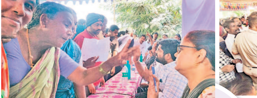
నల్లంపాలపేట: కొమ్ములపంచలో పేదల పేర్లు జాబితాలో చేర్చాలని డిమాండ్ చేస్తున్న మహిళ