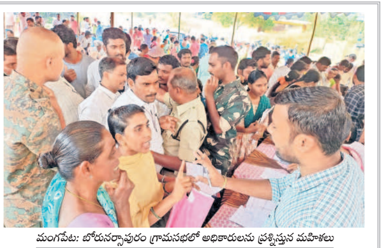
మంగపేట: బోనసర్కారుల గ్రామసభలో అధికారులను ప్రశ్నిస్తున్న మహిళలు

నెల్లికుదురు, జనవరి 24 : ప్రజాపాలనలో మళ్ళీ మళ్ళీ దరఖాస్తు చేసుకున్న మహిళా తక్కువ వర్గ రహితం రావు