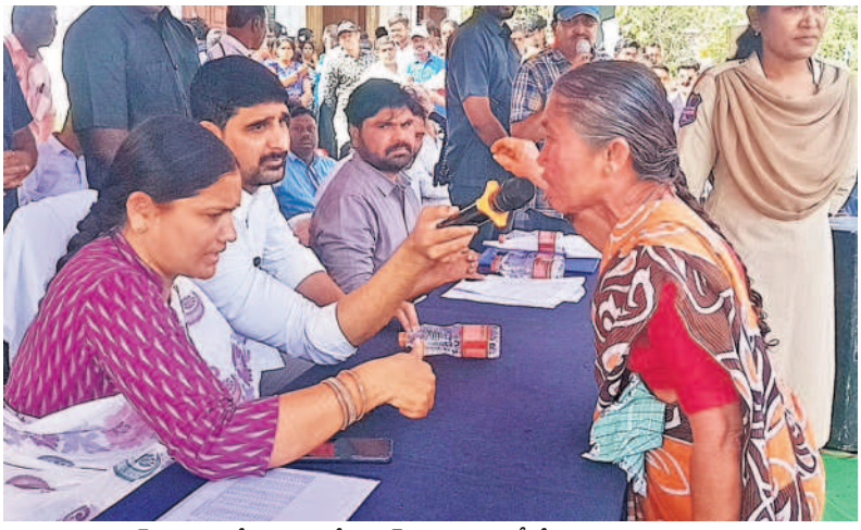
పెన్షన్ రావడం లేదని ఎమ్మెల్యే కౌశికిరెడ్డి సమక్షంలో వేడుకుంటున్న వట్టు సమస్యకర్త